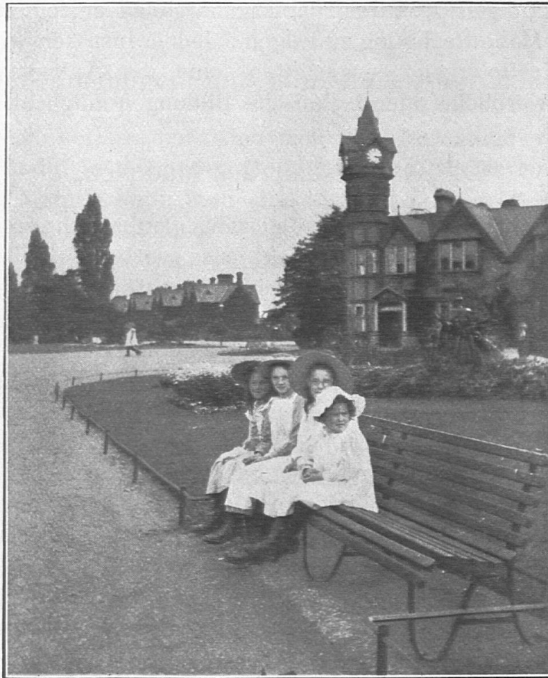
In der Gartenstadt der Mädchen. Barnardo-Museum und Einfamilienhäuschen.

Bettchen, den sauberen Vorhängen, der vollständigen, fast eleganten Ausstattung, nehmen sich aus wie Kinderzimmer einer vornehmen Villa. Und den sauberen und frischen Kindern mit ihren schmucken Kleidchen würde es niemand mehr ansehen, daß sie vor wenigen Wochen noch im größten Schmutz und Elend Londons lebten. Hier zeigt sich deutlich, was das Milieu auszurichten