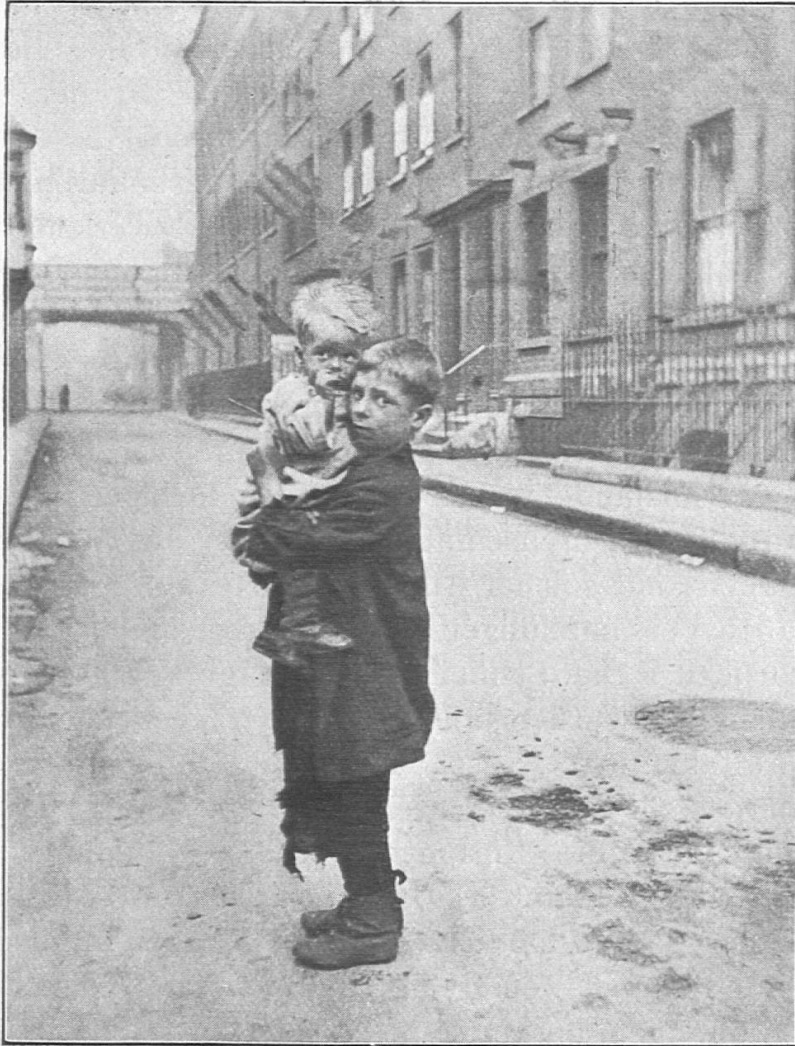
Vor Dr. Barnardos Heim in Stepney-Causeway.

Selbst die zahlreichen Besuche auswärtiger Gäste führen keine Störung mehr herbei; die jungen Leute liegen unverdrossen ihrer Arbeit ob. Ich sah, wie ein Dutzend Zöglinge den Bäckermeister unterstützten und als junge Bäckergehilfen es ermöglichten, täglich sämtliche Londoner Anstalten mit Brot zu versehen. 30 junge