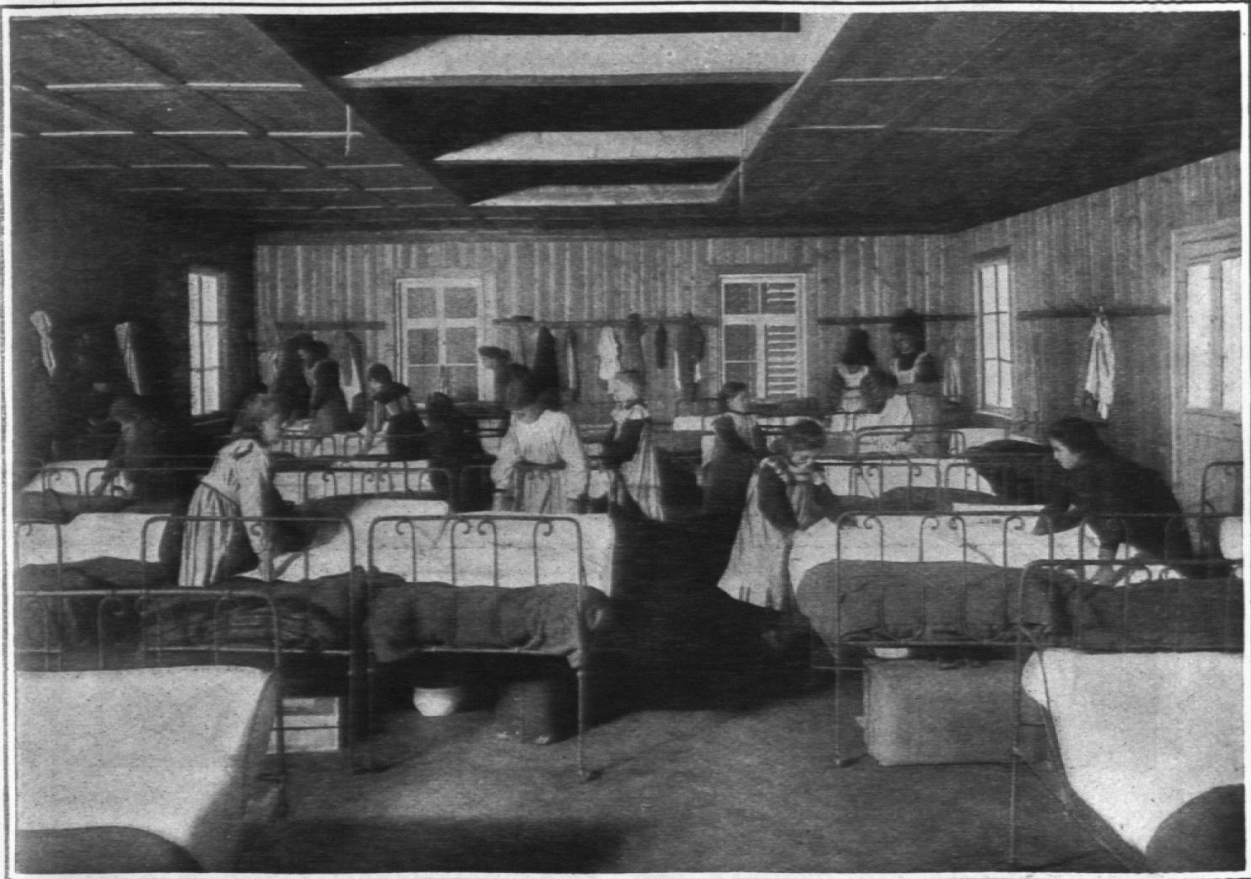
Erholungsstation Schwäbrig. Schlafsaal.

Unterkunftsräumen freilich die Schlafsäle nicht genügend getrennt sind, wo zu wenig Abtritte vorhanden sind, wo dies oder jenes vorhanden ist, was das Zusammenleben der Geschlechter als gefährlich erscheinen lässt, da ist von vorneherein auf diese Forderung zu verzichten. Denn wir dürfen nicht vergessen, aus welcher Umgebung unsere Kinder oft herkommen, was sie nicht alles schon gesehen und gehört haben, was für Dinge in ihrer Phantasie spuken. Die Er-