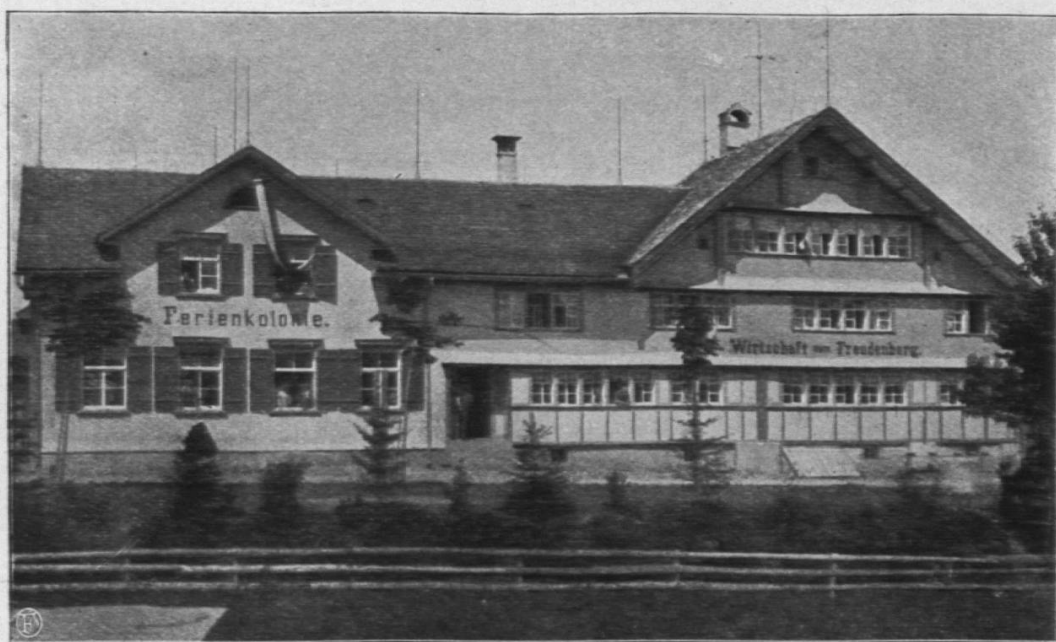
Ferienkolonie „Käsern“ bei St. Peterzell.

Die Regiekolonien geben mannigfache Gelegenheit, die Kinder