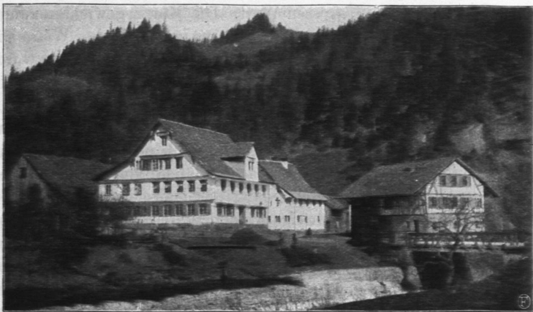
Ferienkolonie „Steg“ im Tösstal.

zu dieser Arbeit bringen kann, dass sie solche gern und willig tun. Vorzuziehen sind solche Arbeiten, welche die Kinder möglichst bald allein verrichten können. Das Gefühl der Selbständigkeit und der freien Leistung macht die Arbeit dem Kinde zur höchsten Lust. Auch die Spaziergänge sollen den Kindern eine Abwechslung und eine Lust sein. Es ist auf dieselben grosses Gewicht zu legen. Mit kleinen fängt man an, und alle Tage wird ein grösserer gemacht. Nicht pedantisch immer zur gleichen Stunde, nicht immer in Kolonnen, zur Abwechslung wird wohl auch von Zeit zu Zeit marschiert. Da werden die Muskeln straffer, und die Brust dehnt sich