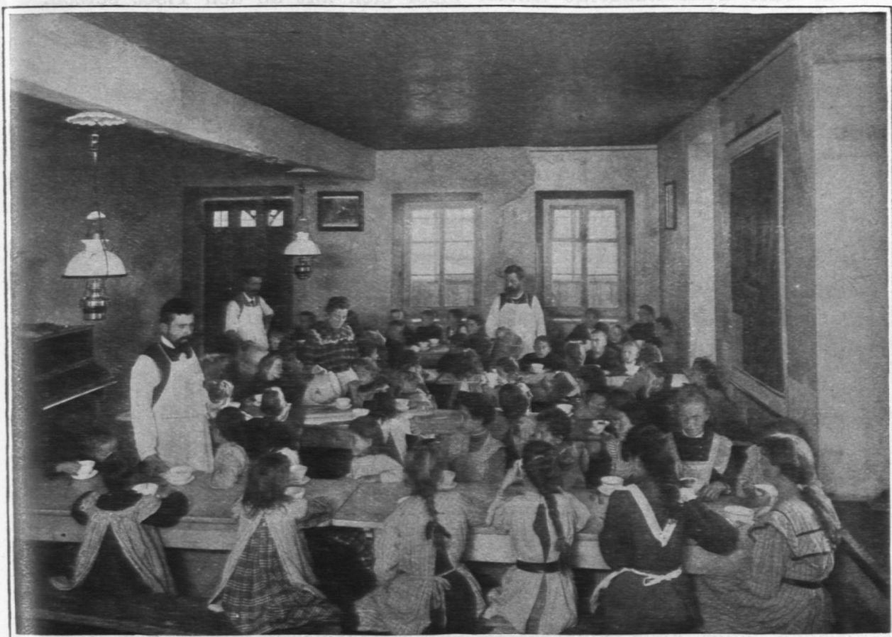
Erholungsstation Schwäbrig. Beim Frühstück.

und Zichorienpäckli, er kauft „Mostsubstanz zur Bereitung eines gesunden Haustrankes“. Das traurigste an der ganzen Sache ist wohl der Mangel an Milch, der in so manchem Bauernhaus herrscht. Es gibt im Kanton Appenzell z. B. Dörfer, wo es den Einheimischen wochenlang während der Fremdensaison beinahe unmöglich ist, frische Eier oder frische Butter zu erhalten. Man denke auch daran, wie in unsern Bauernhäusern der Genuss von Eiern eigentlich als