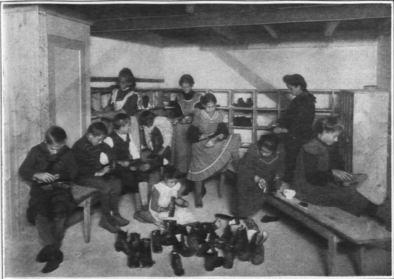
Erholungsstation Schwäbrig. Beim Reinigen der Schuhe.

Ich glaube, dass die Kinder auf diese Weise sehr schöne Ferien erleben, vielleicht noch schönere als in unsern Kolonien. Die Kinder sind in einer Familie. Sie werden als Familienglied angesehen und fühlen sich gar bald auch zu Hause. Sie nehmen an den