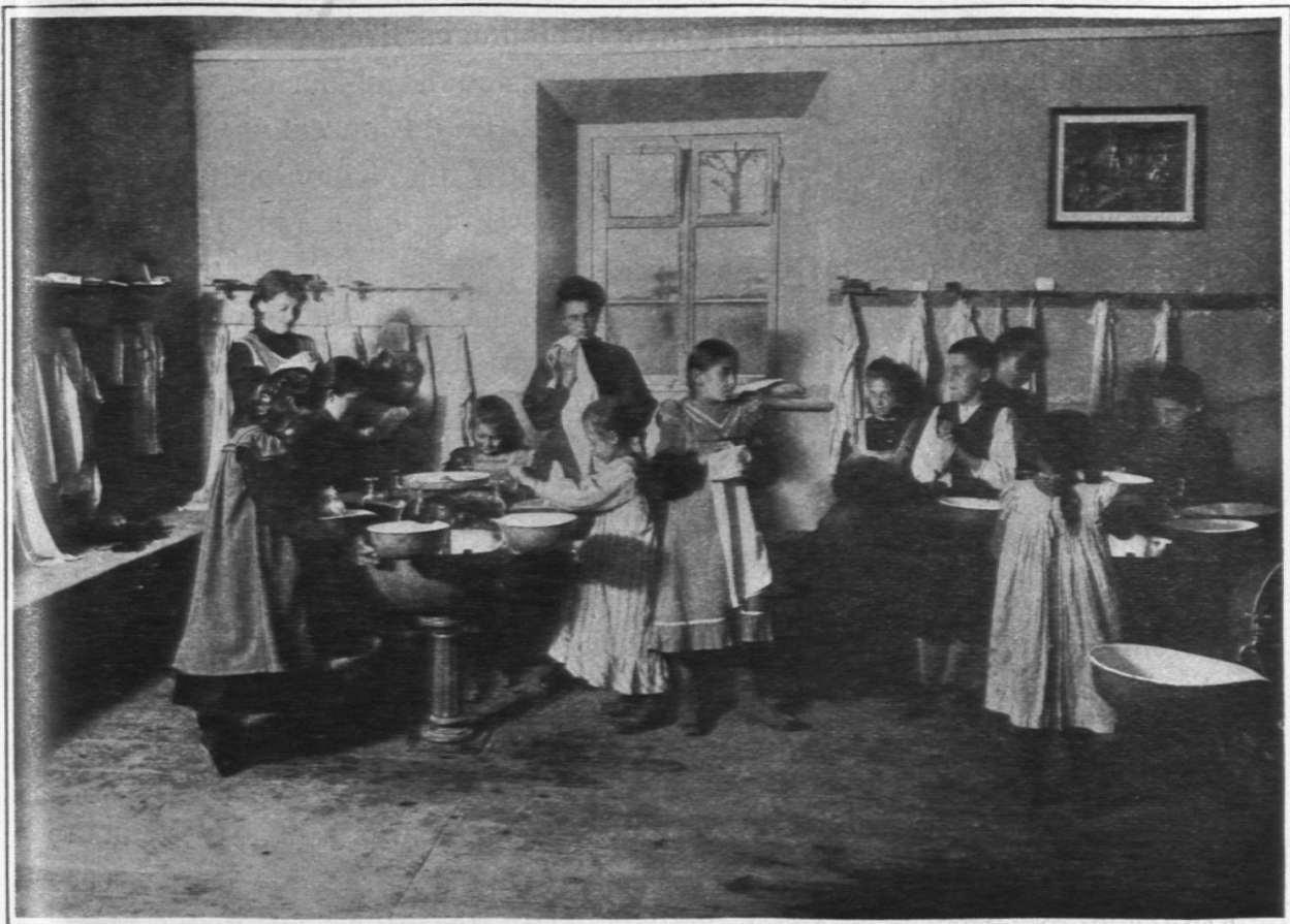
Erholungsstation Schwäbrig. Bei der Toilette.