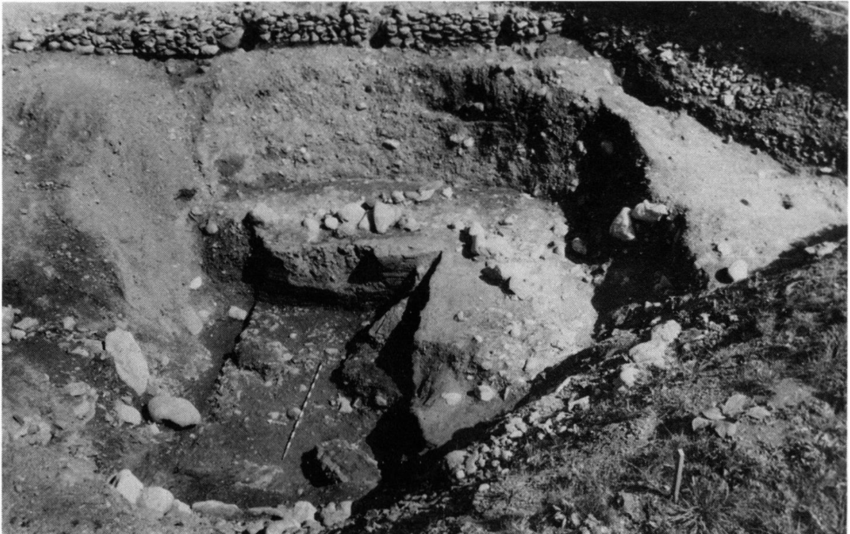
Abb. 1: Savognin, Padnal 1983, Süderweiterung Feld 5/6, Zisternengrube und Zisterne, nach 12. Abstich.