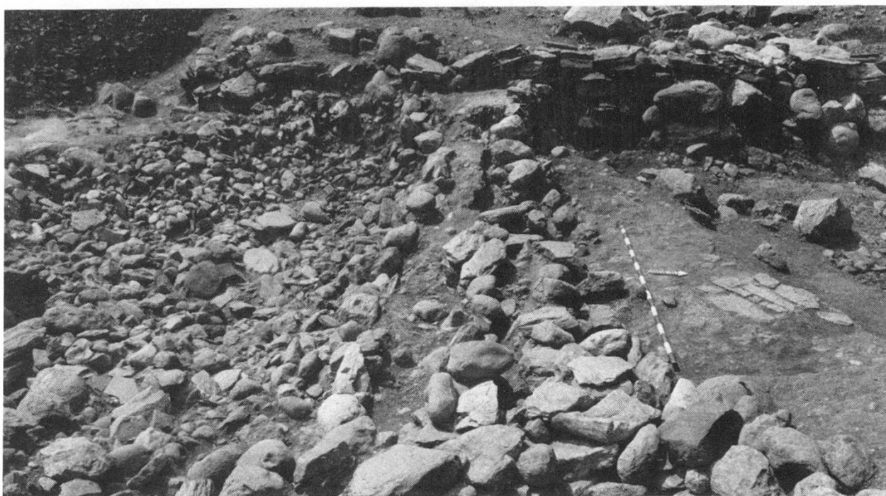
Abb. 1: Feld 5, nach 14. Abstich; Steinreihen des Horizontes E 1 (Bildmitte), Herd 20 (rechts) und Sickerbett oder Steinaufschüttung (links)

In Feld 5 wurden im 12. bis 14. Abstich die Überreste der Kulturschicht der Horizonte D und E abgebaut. Diese Kulturschicht enthielt viel rötlichen Brand und Holzkohle und eine beträchtliche Menge an verkohlten Vegetabilien.