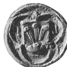
23 c. Leonhart 1456–1458