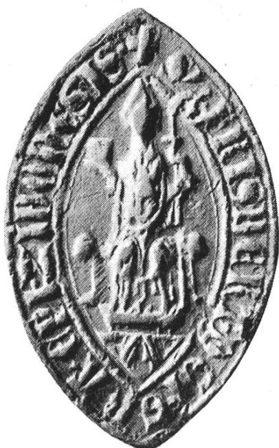
27. Berthold ep. Zimbonensis 1316