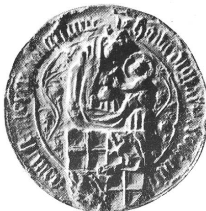
22 a. Heinrich IV. 1441—1456