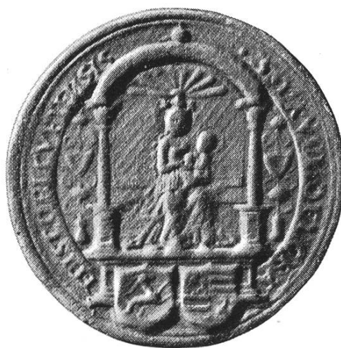
26 b. Paul I. (1506) 1509–1541