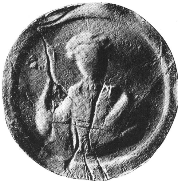
1. Heinrich I. 1070 – 1078