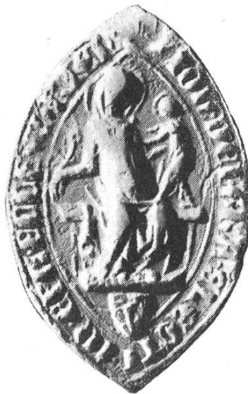
13. Johannes I. 1325–1331