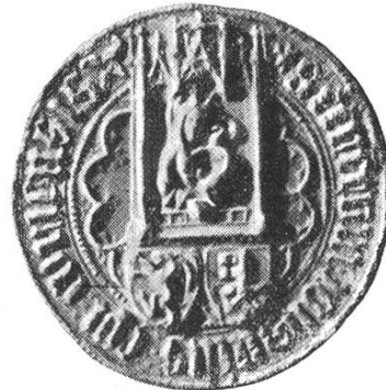
17b. Johannes II. 1376–1388