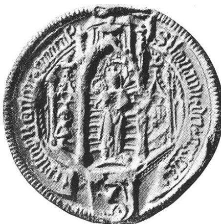
23 a. Leonhart 1456–1458