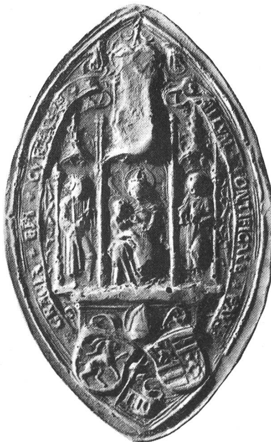
26c. Paul I. (1506) 1509–1541