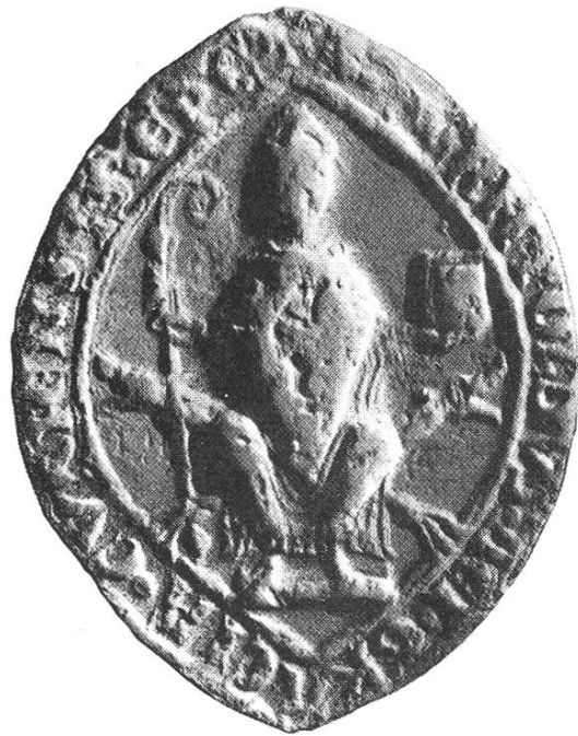
5b. Berthold I. 1228 – 1233