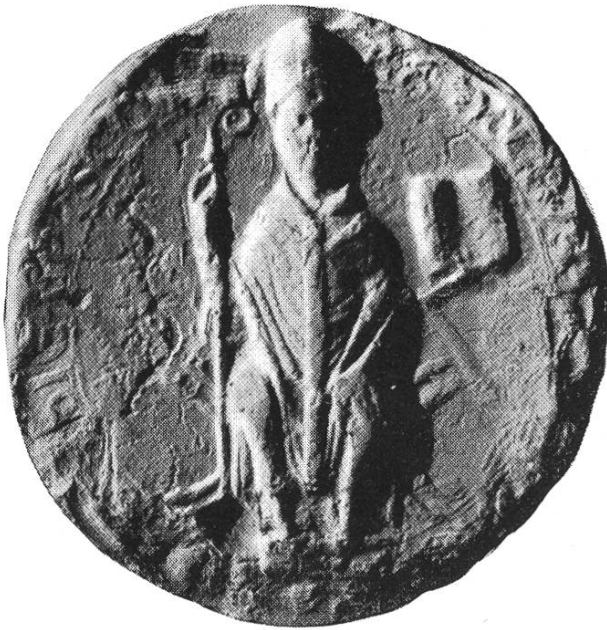
4a. Arnold 1210 – 1221