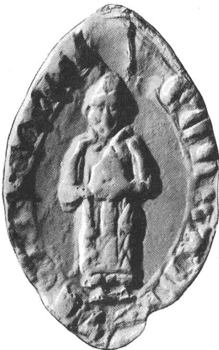
8 b. Konrad III. 1272—1282