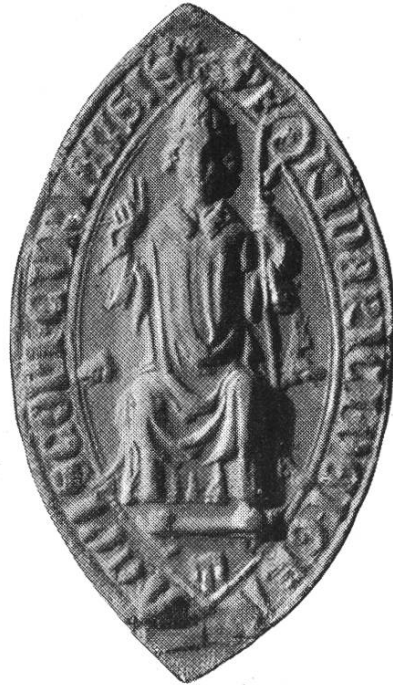
9b. Friedrich I. 1282—1290