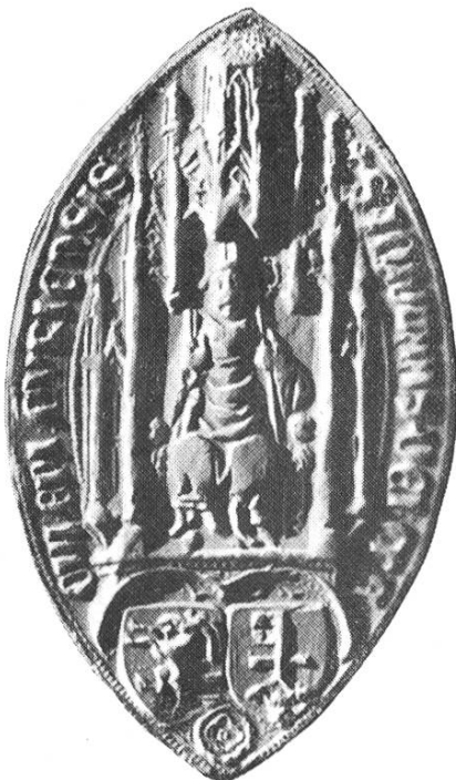
17a. Johannes II. 1376—1388