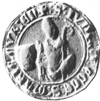
35 c. Geistliches Gericht seit 1343