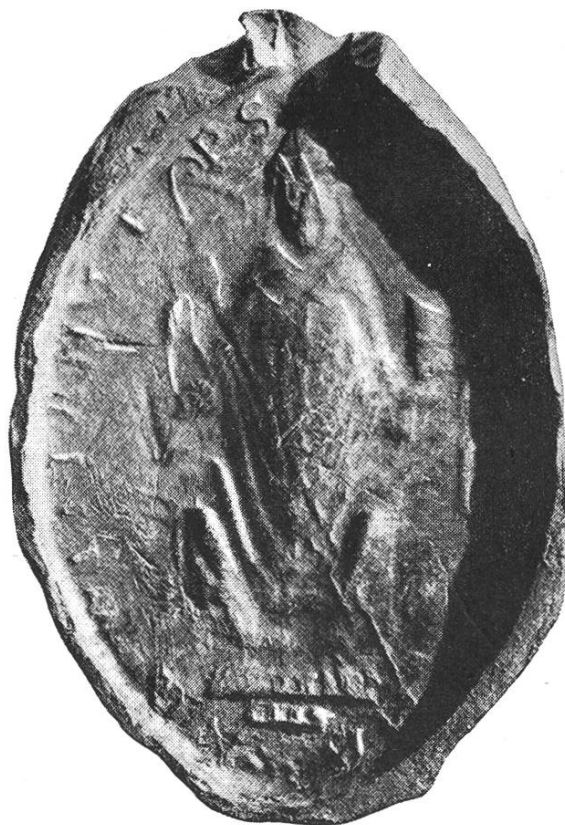
34. Berno ep. Magnopolitanus 1178