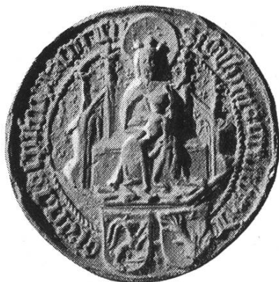
24a. Ortlieb 1458 – 1491