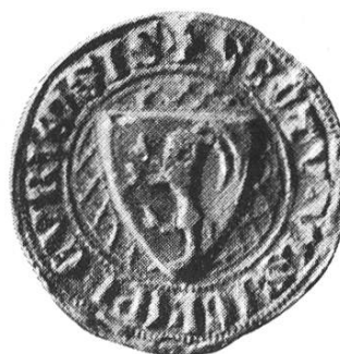
14e. Ulrich V. 1331–1355