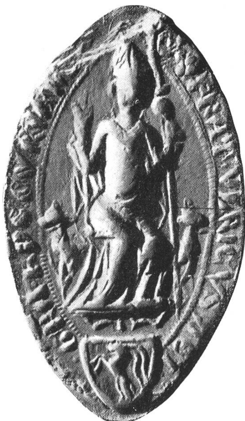
14a. Ulrich V. 1331–1355