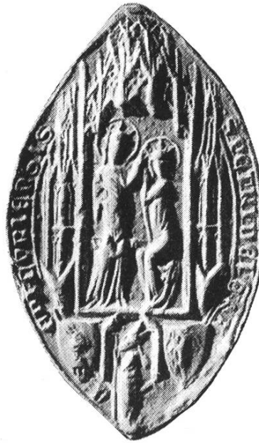
15. Peter I. 1355–1368