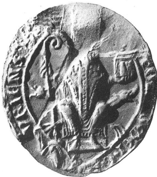
5a. Berthold I. 1228 – 1233