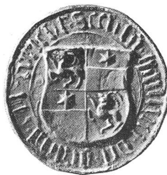
25c. Heinrich V. 1491 – 1509