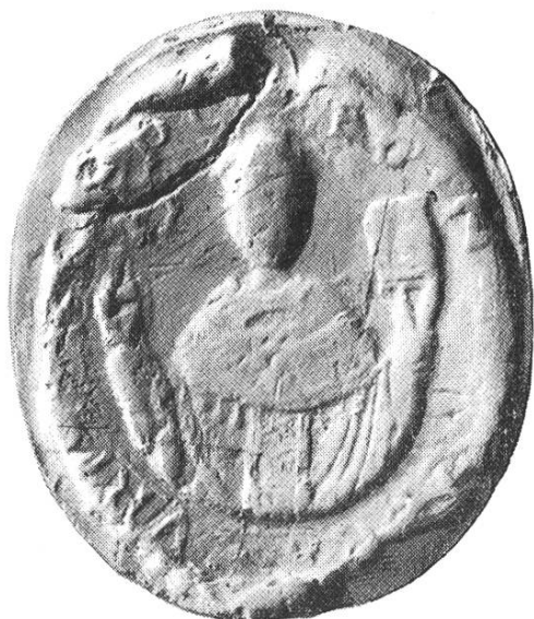
2a. Eginowald ca. 1160 – 1170