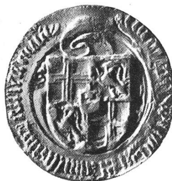
22c. Heinrich IV. 1441—1456