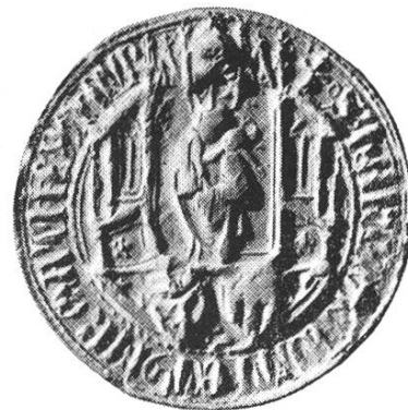
18 d. Hartmann II. 1388—1416