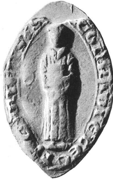
8 a. Konrad III. 1272—1282