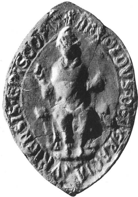
4b. Arnold 1210 – 1221