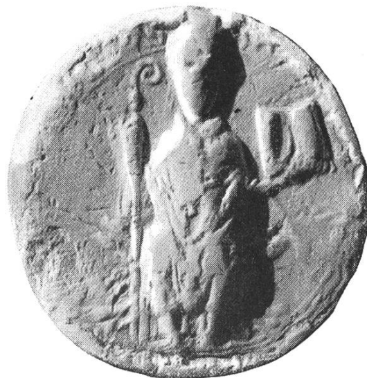
2b. Eginowald ca. 1160 – 1170