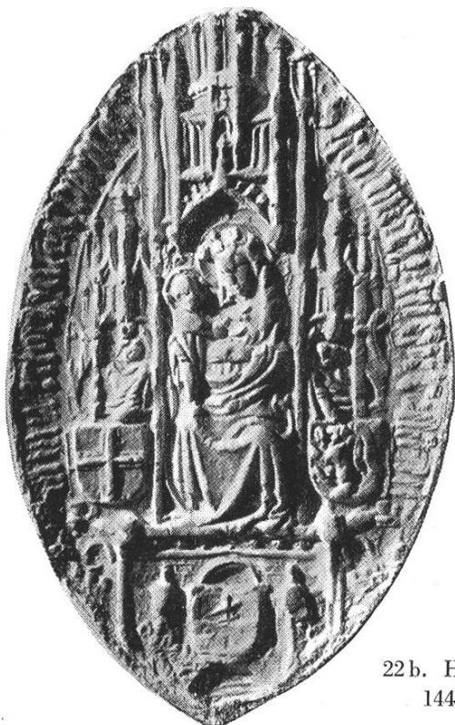
22b. Heinrich IV. 1441—1456