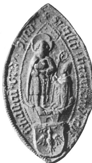
31. Burkard ep. Sebastensis 1470, 1490