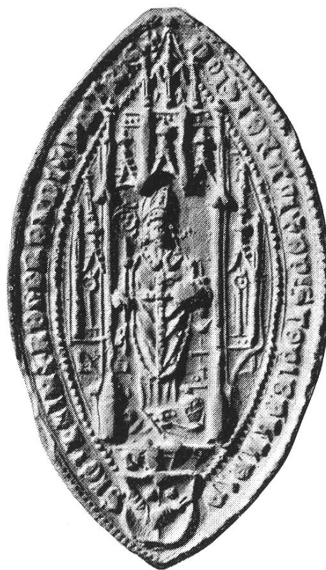
33. Stephan ep. Bellinensis 1503, 1533