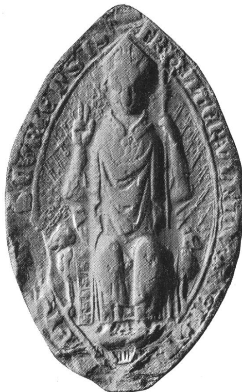
14b. Ulrich V. 1331–1355