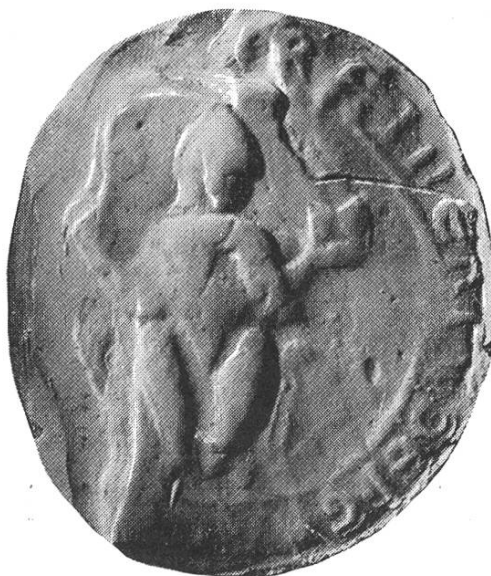
3. Reiner 1200 – 1209