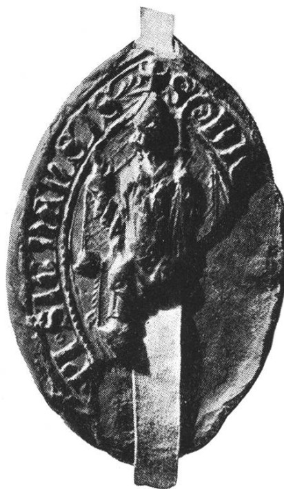
28. Dietrich ep. Signensis 1392, 1398