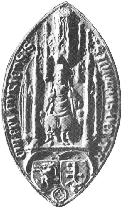
17a. Johannes II. 1376–1388