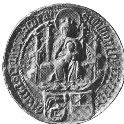
25a. Heinrich V. 1491 - 1509