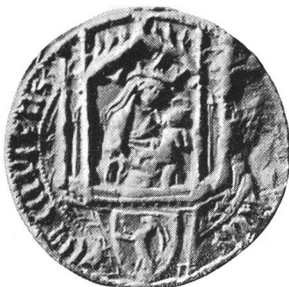
19. Johannes III. 1416—1418