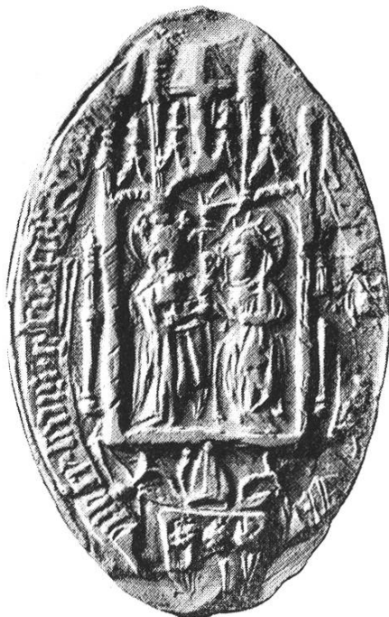
32. Belthasar ep. Troianus 1491, 1495, 1500