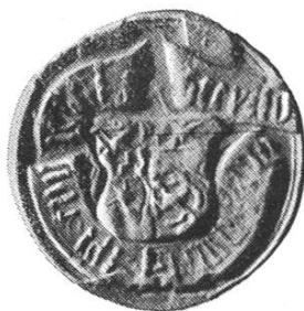
25b. Heinrich V. 1491 – 1509