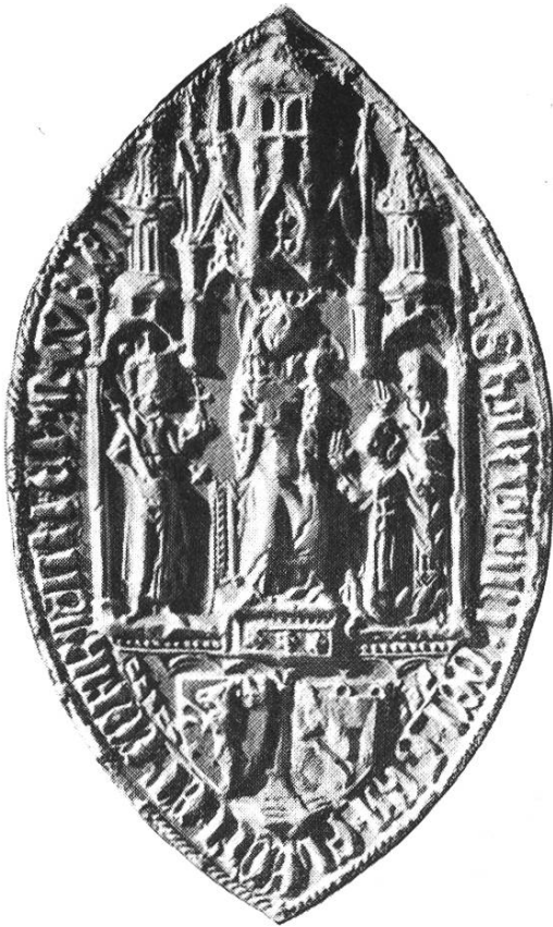
18 a. Hartmann II. 1388—1416