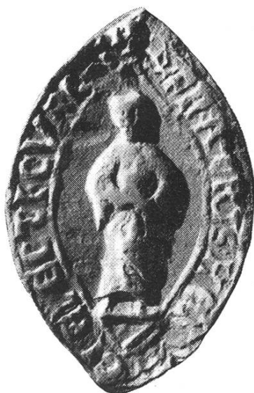
7a. Heinrich III. 1251 – 1272