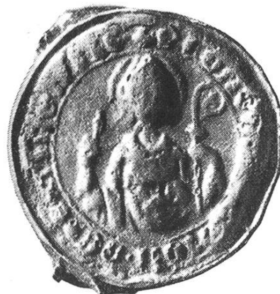
35 e. Geistliches Gericht seit 1467