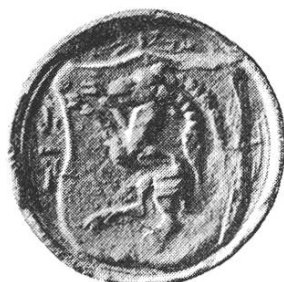
23 b. Leonhart 1456–1458