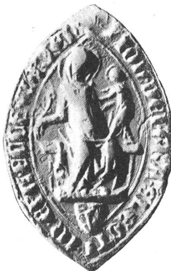
13. Johannes I. 1325 – 1331