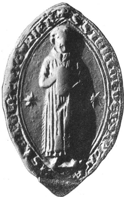
11 a. Siegfried 1298 – 1321