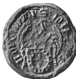
29. Johannes ep. Thinorum 1441