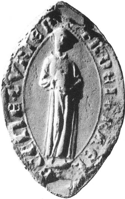
9a. Friedrich I. 1282—1290