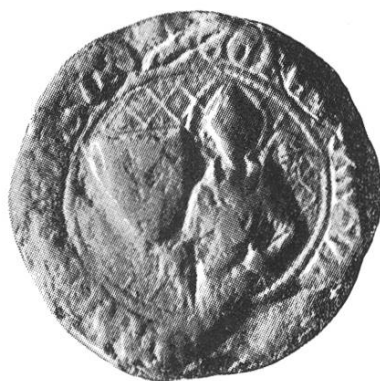
14d. Ulrich V. 1331–1355