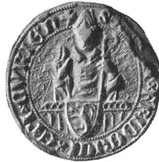
16b. Friedrich II. 1368–1376