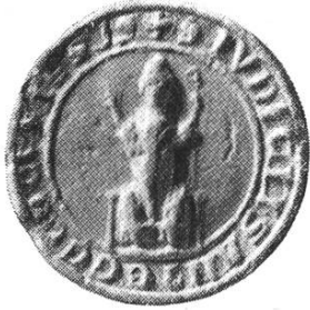
35 a. Geistliches Gericht seit 1296