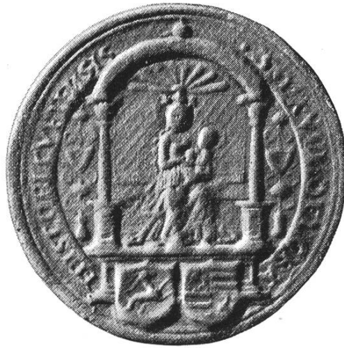
26b. Paul I. (1506) 1509–1541