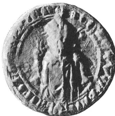
14c. Ulrich V. 1331–1355