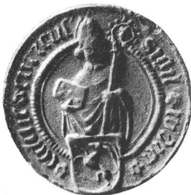
35 d. Geistliches Gericht seit 1379