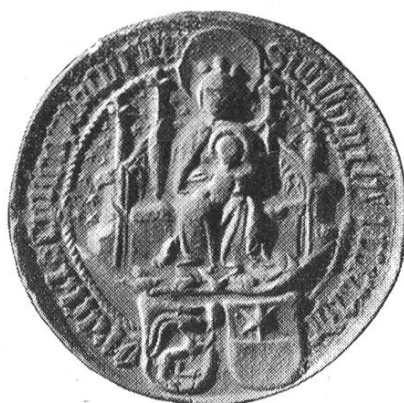
25a. Heinrich V. 1491 – 1509