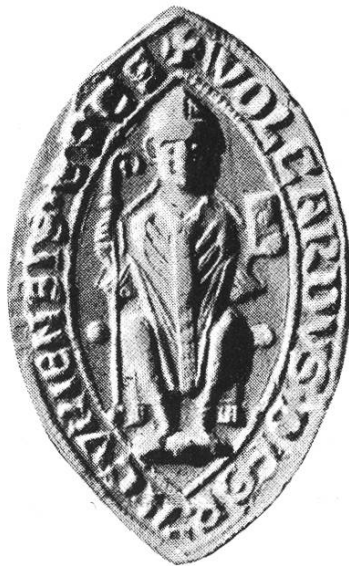
6. Volkart 1237 – 1251