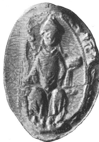
8c. Konrad III. 1272–1282