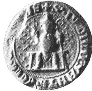
35 b. Geistliches Gericht seit 1327