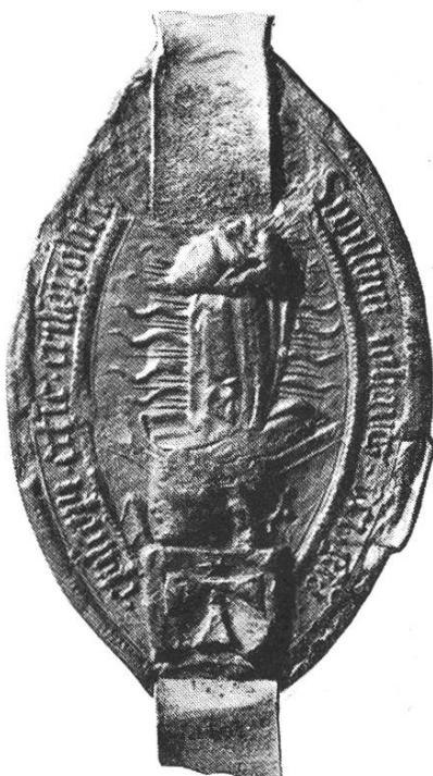
30. Johannes ep. Crisopolitanus 1459, 1463