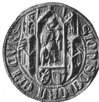
20. Johannes IV. 1418—1440