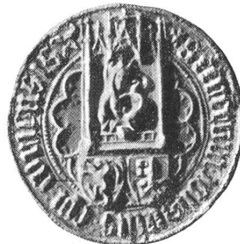
17b. Johannes II. 1376—1388