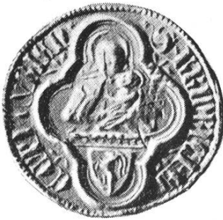
16a. Friedrich II. 1368–1376