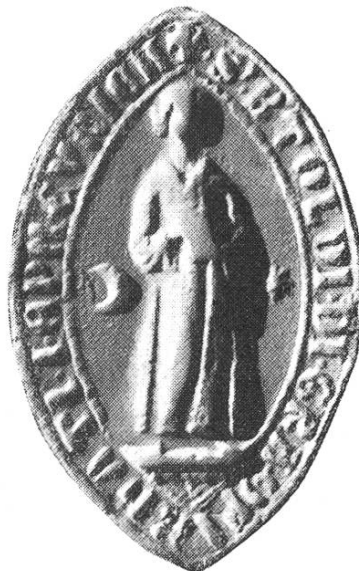
10. Berthold II. 1290—1298