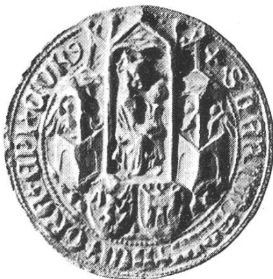
18 c. Hartmann II. 1388—1416