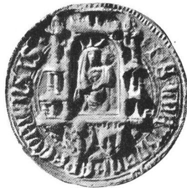
18 b. Hartmann II. 1388—1416