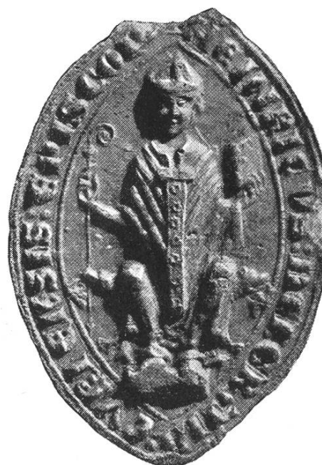
7b. Heinrich III. 1251 – 1272