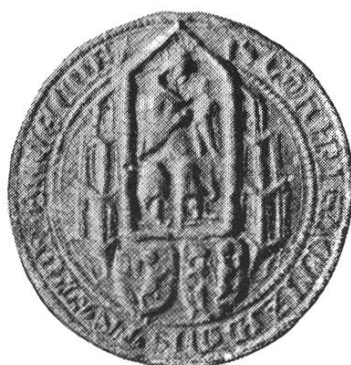
21. Konrad v. Rechberg 1440—1441