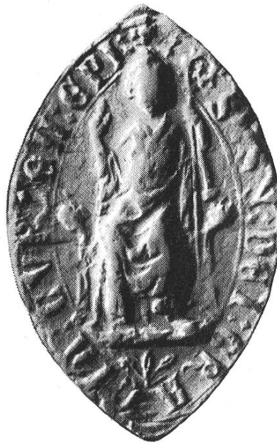
11 b. Siegfried 1298 – 1321