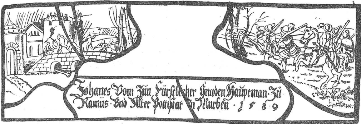
GLASGEMÄLDE IM RÄT. MUSEUM.