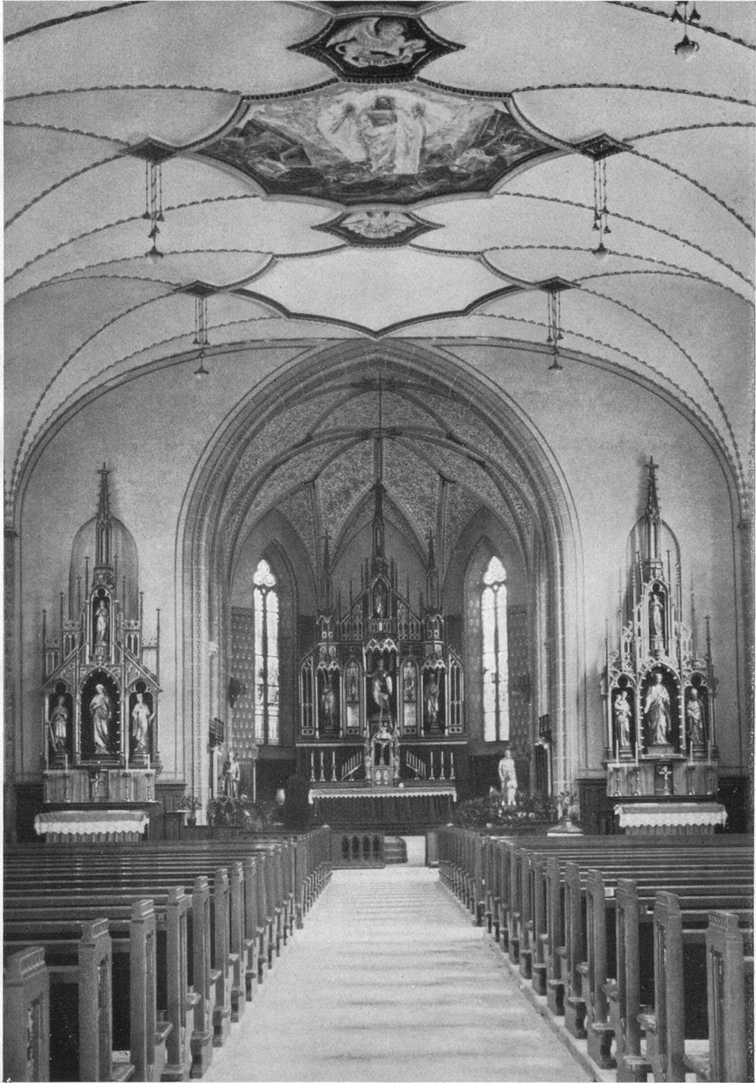
Interior della baselgia nova de Gams