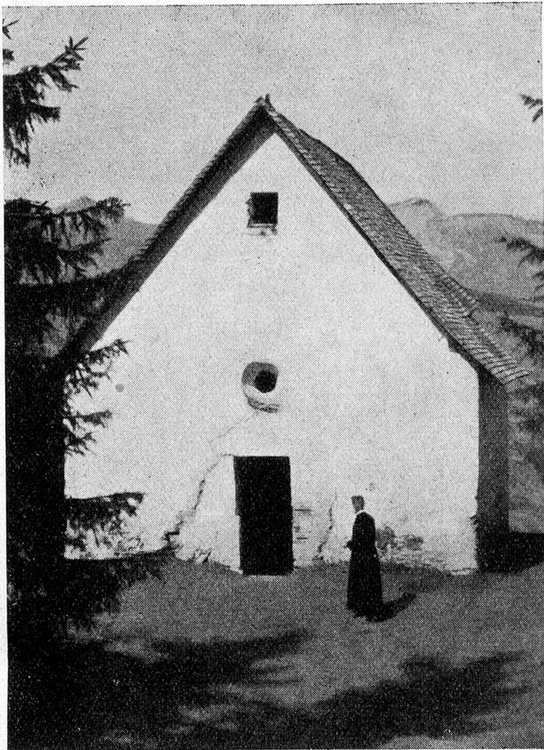
Caplutta de s. Carli sil Mundaun (dador) (Il plevon, Sur Solèr, passa grad en caplutta!)

tschentaner vergau, e refrestgentan suontai pelegrins e viandonts lur ardenta seit culla bun'aua frestga ord la fontauna de s. Carli leu sut la caplutta. La caplutta 6,5 m. lada e 10 m. liunga purtava pli baul in cavalier per clutgè cun in zennetpil survetsch divin, sco era per dar avis a viandonts e pelegrins