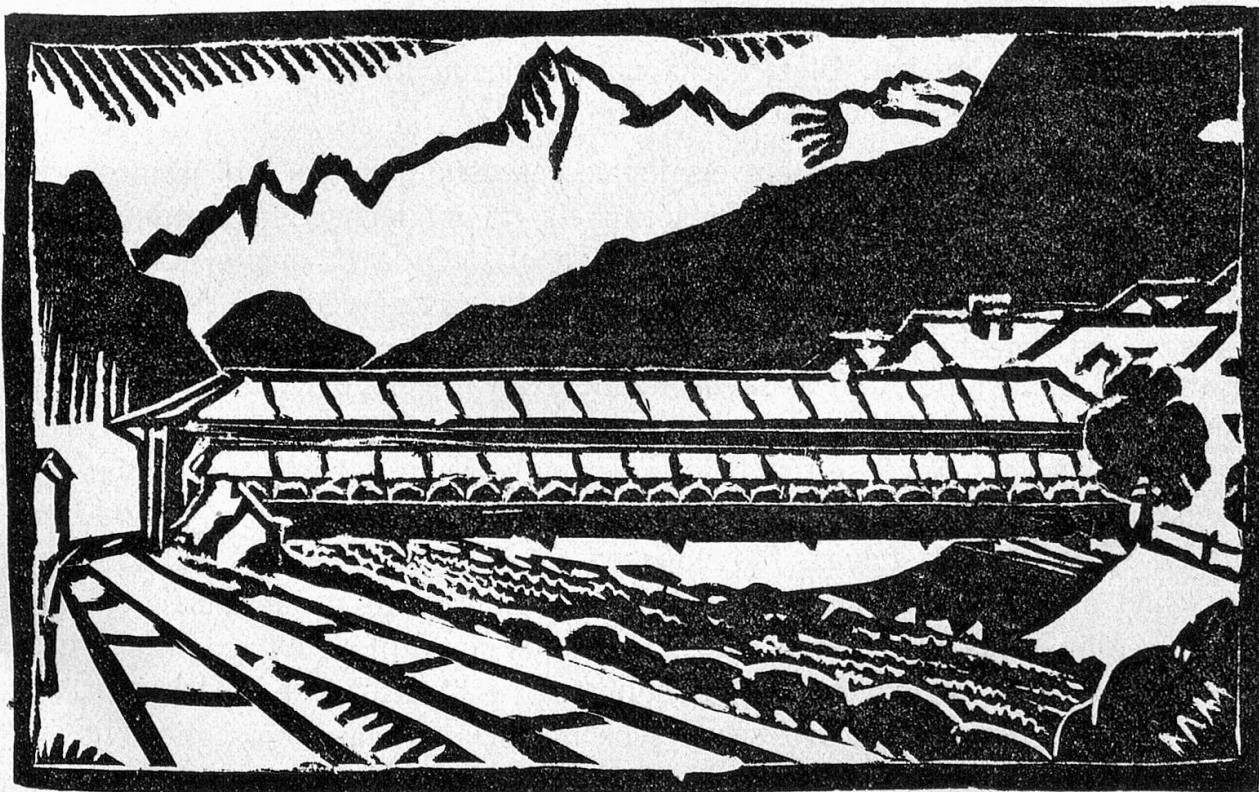
La punt-lenn a Glion