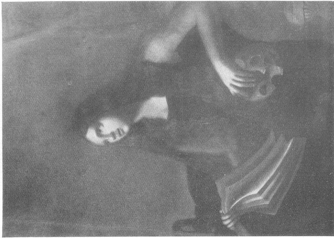
Sontga Madleina a Mutshnengia