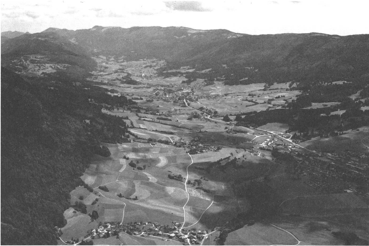
Photo 1: La Vallée de Tavannes est la partie supérieure de la vallée de la Birse, délimitée par la chaîne de Montoz au sud (à droite) et de la chaîne de Moron au nord (à gauche).