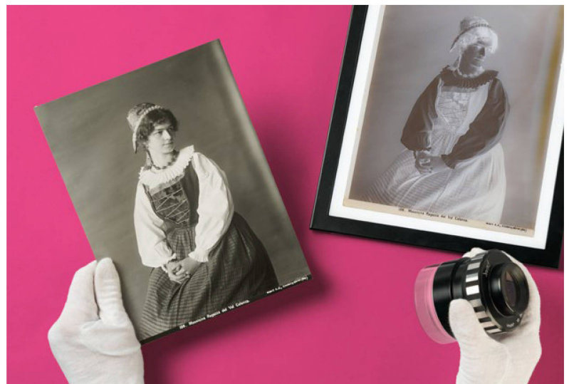
Photographie-Verlag Wehrli AG

Im Berichtsjahr wurden über 13'000 gemeinfreie Bilder aus der Graphischen Sammlung auf die Plattform Wikimedia Commons (WMC) hochgeladen, womit sich die Gesamtzahl auf 38'000 erhöhte. Die Zahl der Zugriffe entwickelte sich auf erfreuliche 20,5 Mio. (2023: 16,8 Mio.). Mit zur hohen Nutzung beigetragen hat auch eine zweitägige GLAM on tour -Veranstaltung, die zusammen mit Wikimedia CH im Juni 2024 durchgeführt wurde. Die Veranstaltung fokussierte auf die digitalisierten Bilder aus dem Archiv des Photographie-Verlags Wehrli AG , der vor 100 Jahren mit Photoglob fusionierte.