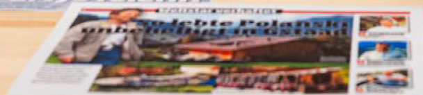
Chalet. Sehnsucht, Kitsch und Baukultur