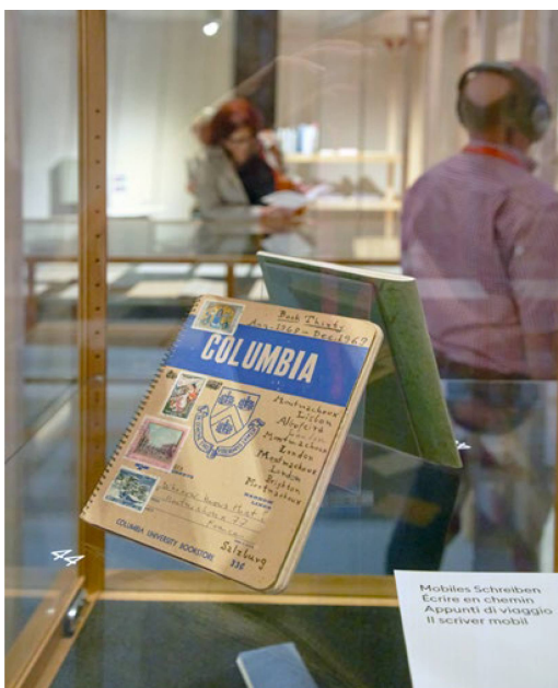
Mobiles Schreiben Ecrire en chemin Appunti di viaggio Il scriver mobil