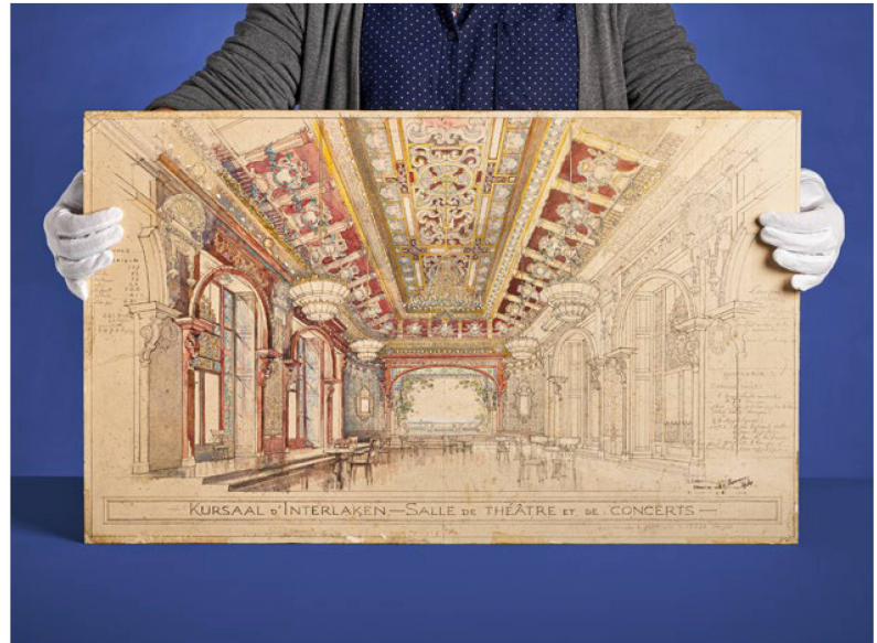
Paul Bouvier (1847–1940)

Die Anzahl Nutzungsanfragen lag mit 745 etwas unter dem Vorjahr (2021: 775). Gefragt waren v. a. die Sammlungsbereiche Denkmalpflege und Fotografie. Die Zahl der Besucherinnen und Besucher vor Ort war mit 116 höher als im Vorjahr (2021: 91). Für zehn Ausstellungen wurden rund 80 Originaldokumente ausgeliehen. Erwähnenswert