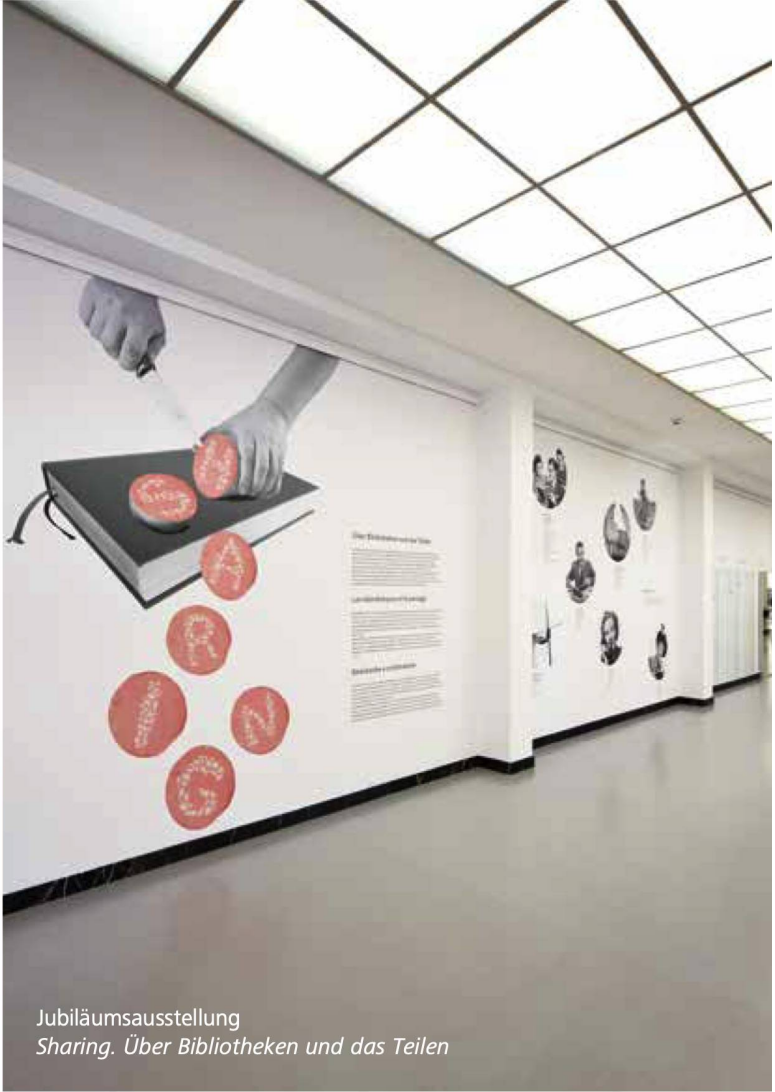
Jubiläumsausstellung Sharing. Über Bibliotheken und das Teilen