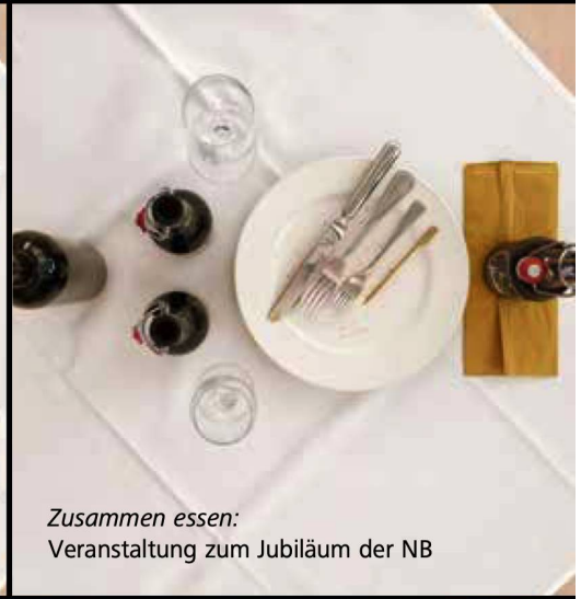
Zusammen essen: Veranstaltung zum Jubiläum der NB