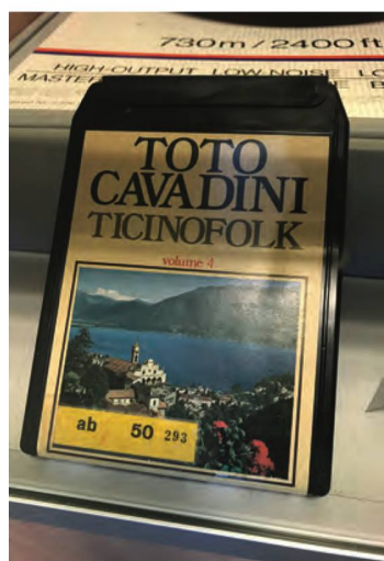
Die Phonothek sammelt auch historische Tonträger wie 8-Spur-Kassetten