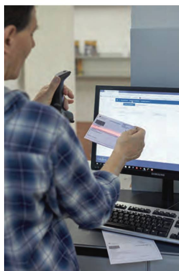
2018 war von der Umstellung auf ein neues Bibliotheksverwaltungssystem geprägt