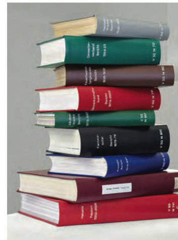
Papierdokumente, die in die NB gelangen, werden zur Aufbewahrung gebunden