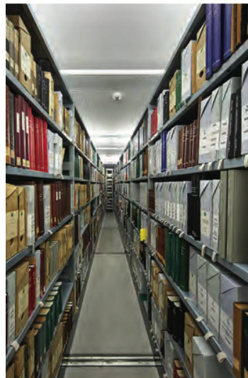
Im Projekt VIVA wurde die vielfältige Dokumentation über die Schweizer Vereine und Institutionen katalogisiert

Die NB sammelt sowohl gedruckte als auch digitale Dokumente. Ende 2018 erreichte die digitale Sammlung ein Volumen von rund 25 TB (2017: 21 TB). Die original digitalen Dokumente beliefen sich Ende 2018 auf über 130'000 Archivpakete, was im Vergleich zu 2017 (rund 107'000 Pakete) eine Steigerung von rund 20% ausmacht. Hinzu kommen 42'577 Archivpakete digitalisierter Dokumente (2017: 42'489). Das Projekt zur Überführung des Archivierungssystems für e-Helvetica auf die Server-Infrastruktur der Schweizerischen Nationalphonothek nähert sich dem Abschluss.