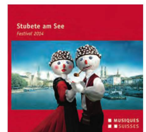
Stubete am See