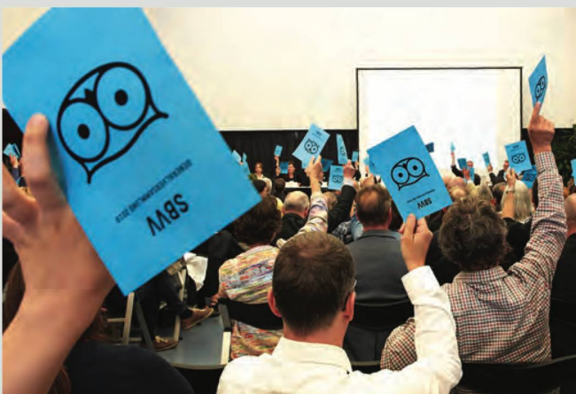
Die Jahresversammlung des SBVV fand erstmals in der NB statt.