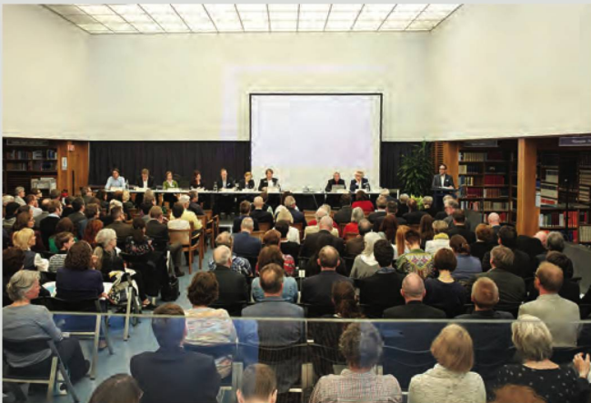
Am 14. Mai 2018 trafen sich an der Jahresversammlung des SBVV in der NB rund 170 Personen.