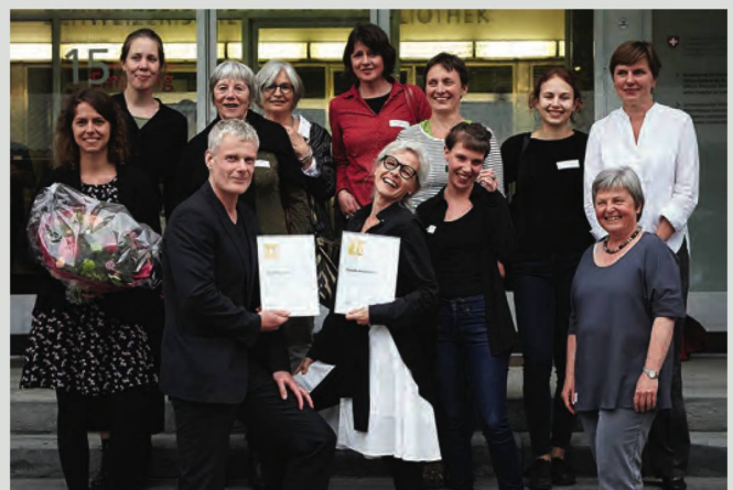
Die Preisträgerinnen und Preisträger der SBVV-Preise vor der NB