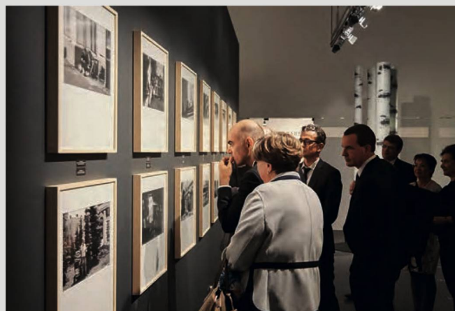
Bundesrat Alain Berset betrachtet mit weiteren Besucherinnen und Besuchern die Fotos von Mirko Krizanovic.