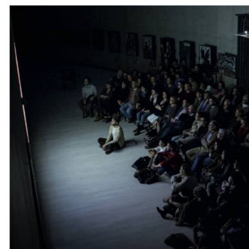
Museumsnacht im CDN, 18.5.2013