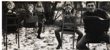
Dieter Roth, die frage nach familie, stühlen und katze , 1968, © Dieter Roth Estate, Hauser & Wirth Fotografie Familie Stauffer, 1967 (Vorlage für die Arbeit von Dieter Roth), Fotografie: Serge Stauffer