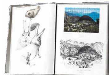
Skizzenbuch von Hans Witschi

WITSCHI, Hans, Skizzenbuch 1985–1987 , 1 Heft, 1985–1987.