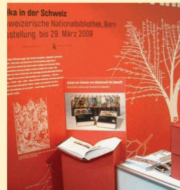
Die NB an der Buch.08, Foto: HDA