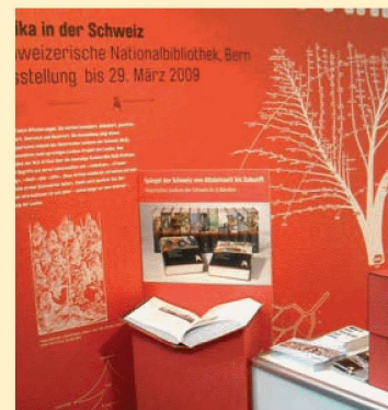
Die NB an der Buch.08