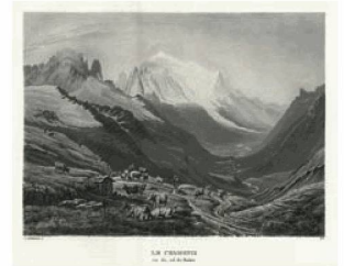
Die NB ist Partnerin im Projekt ViaticAlpes: Les images des Alpes dans les récits de voyage de la Renaissance au XIX e siècle ( www.unil.ch/viaticAlpes ).

Einen grossen Schritt weitergekommen ist die NB in der Digitalisierung. Neben der bereits erwähnten Plattform Digicoord stand die Digitalisierung von Zeitungen im Vordergrund. In der Westschweiz konnte sie dank einer Rahmenvereinbarung mit Presse Suisse institutionalisiert werden. Die NB beteiligt sich an Digitalisierungsprojekten von Zeitungen, wenn sich auch der Verlag und eine kantonale oder lokale Bibliothek dafür engagieren. Als erstes wurde das Journal de Genève nach diesem Prinzip bearbeitet; seit Dezember ist es kostenfrei online zugänglich. 10 Die Projektleitung lag beim Verlag Le Temps , weitere Projektpartnerin war die Bibliothèque de Genève. Die NB stellte neben Geld vor allem ihr Fachwissen zur Verfügung. Vereinbarungen für die Digitalisierung der Gazette de Lausanne sowie der Neuenburger Zeitungen L'Express und L'Impartial wurden im Berichtsjahr unterzeichnet.