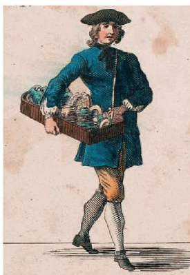
BLATTEN KRAMEN, BLATTEN. VOLFEL, THERGSCHIR, CHRUSLIEN Ich hab zwar Schin und fein Geschir, Wem aber bricht, wer kan dafür?

PETRINI, Ugo : Sfogliando il paesaggio marchigiano... / [presentazione grafica e ill. di Carla Ferriroli]. – [S.l.] : [C. Ferriroli], 2006. – [12] p. : ill. ; 25 cm