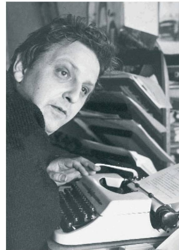
Peter Bichsel