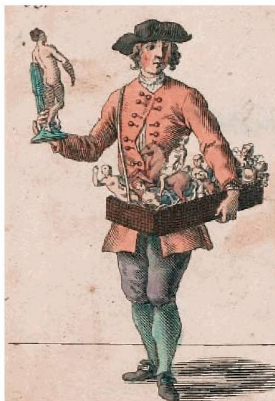
WER WIL SCHÖNE GIPS-BILDER KRAHMEN? Was fehlt den Bildern? Sag es doch: Nichts, als das Leben mangelt noch

BERTHOUD, Ferdinand : Les longitudes par la mesure du temps, ou, Méthode pour déterminer les longitudes en mer, avec le secours des horloges marines : suivie du recueil des tables nécessaires au pilote pour réduire les observations relatives à la longitude & à la latitude. – A Paris : chez J.B.G. Musier fils, 1775. – IV, 90, 34 p., [1] f. de pl. dépl. ; 26 cm