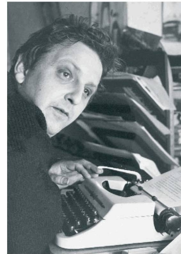
Peter Bichsel