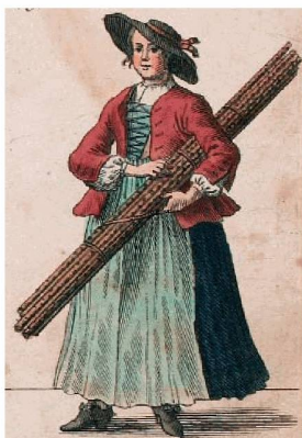
MÜNDER KEY LANG STEKE HAI Hier sind zu kauffen lange stecken, beziert mit knorren u. mit stecken.