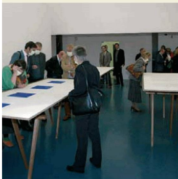
Rudolf De Crignis: Surface

Ausstellung der in seinem Werk einzigartigen, von der Graphischen Sammlung der SLB herausgegebenen Edition im Kontext anderer Papierarbeiten des Ende 2006 verstorbenen Schweizer Künstlers.