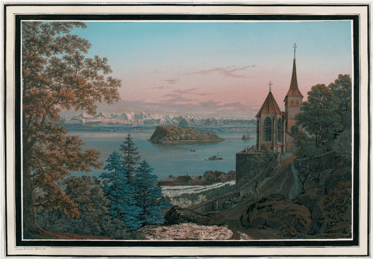
Johann Joseph Hartmann: Ansicht St. Petersinsel. Biel 1802