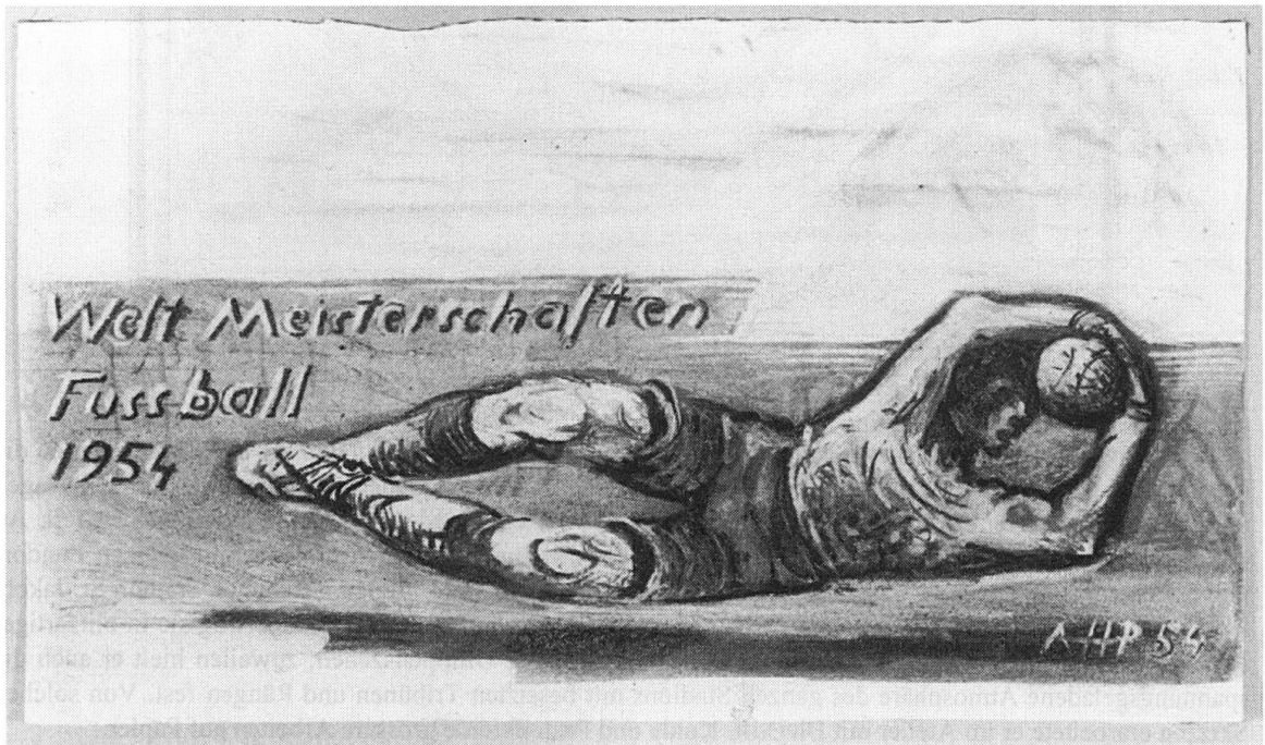
Alfred Heinrich Pellegrini. Welt-Meisterschaften Fussball 1954 . Kohle auf festem Zeichenpapier, 25,9 x 43,4 cm. Vorlage zur Reproduktion in den Basler Nachrichten , 16./18. Juni 1954

Seit Bestehen der Landesbibliothek wird in der Graphischen Sammlung Bildmaterial zur schweizerischen Geographie, Kultur, Geschichte erworben und den Benutzern zur Verfügung gestellt. Dazu gehören auch Darstellungen zum Thema Sport.