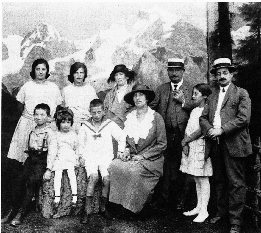
Nach der bürgerlichen Gleichstellung 1874 integrierten sich die Schweizer Juden schnell in die schweizerische Gesellschaft: Jüdische Schweizer Familie vor heimischer Kulisse

Diesem Interesse und Bedürfnis nach Information kommt die Ausstellung entgegen. Sie zeigt in dichter Form die Vielfalt, die Herkunft, die Berufe, den Alltag, den Glauben und die Geschichte der Schweizer Juden. Sie nimmt auch Bezug auf besondere Themen wie die nachrichtlosen Vermögenden, die Beziehung zu Israel und den Antisemitismus.