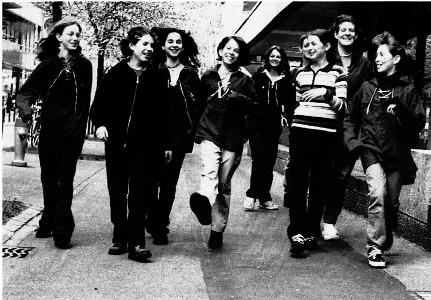
Jüdische Jugendliche gehen mit denselben Hoffnungen und Erwartungen ihrer Zukunft entgegen wie ihre christlichen Kolleginnen und Kollegen. Jugendgruppe Haschomer Hazair, Zürich 1998

Normalverdienende und Arbeitslose (Die Berufe der Schweizer Juden)» zeigen, dass hier auf leichte aber doch fundierte Art Information vermittelt wird. Neben Bild- und Textdokumenten sind auch Statements einzelner jüdischer Schweizer und Schweizerinnen zu hören. In einem speziell für die Ausstellung angefertigten Video sind christliche und jüdische Schweizer Jugendliche in einem interessanten Gespräch zu sehen, und nicht zuletzt können die Besucher in dem als Archiv ausgestalteten Geschichtsteil selbst in Dokumenten blättern.