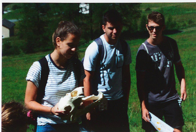
Biosfera Val Müstair, beim Erlebnistag «Rückkehr der Grossraubtiere» hilft Anschauungsmaterial die Biologie von Bär, Wolf und Luchs besser zu verstehen