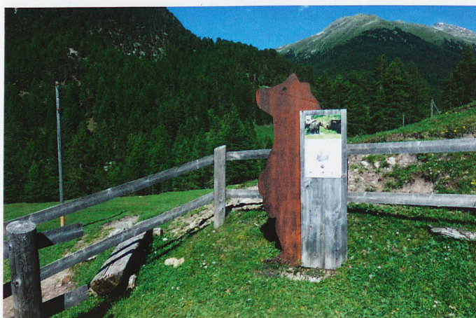
Unesco-Bioshärenreservat Engiadina Val Müstair, auf den Spuren des Bären an interaktiven Stationen die Lebensweise und Biologie des Bären aktiv erleben

Schweiz und den ganzen Alpenraum einzigartiger und faszinierender Erlebnisraum entstanden.