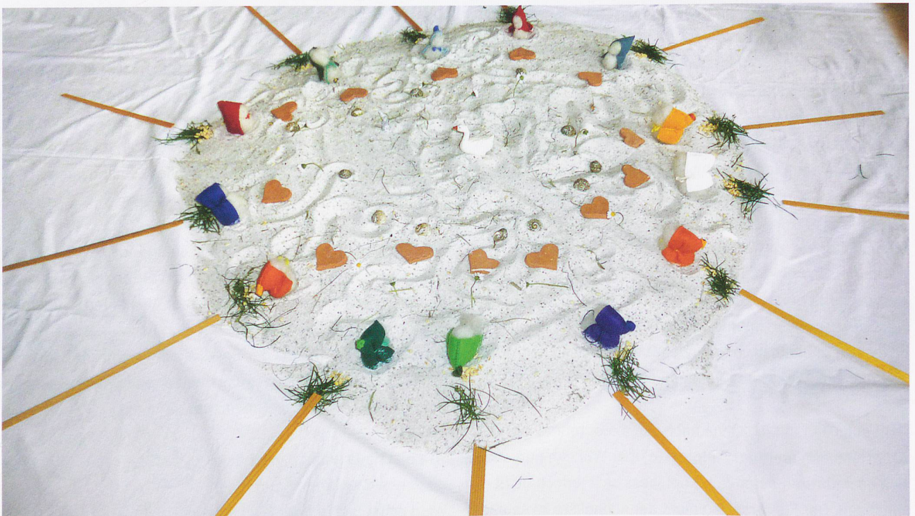
Auf der «Sandbühne» bleibt immer etwas von früheren Geburtstagen bestehen.

Rituale können enorme Wirkung entfalten und werden deshalb oft sehr gezielt genutzt. Bald pensionierte Kolleginnen und Kollegen können heute noch davon erzählen, wie in ihrer Schulzeit und in den ersten Berufsjahren Rituale zur körperlichen Disziplinierung, Blossstellung und Bestrafung eingesetzt wurden.