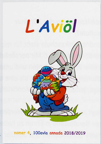
28 paginas in culur > cuosts d'abunamaint : 15.-