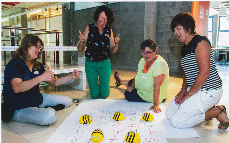
Bee-Bots im Einsatz auf einem selbstgezeichneten Gitternetz