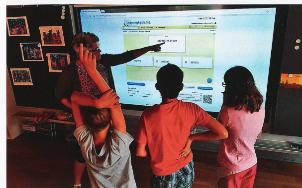
Grosse Begeisterung beim gemeinsamen Lösen einer kniffligen Aufgabe an der interaktiven Wandtafel im Klassenzimmer von Andrea Hausherr

drei Bereiche sowie die Festlegung der Stundendotation führt zu folgenden vier schulelevanten Konsequenzen: