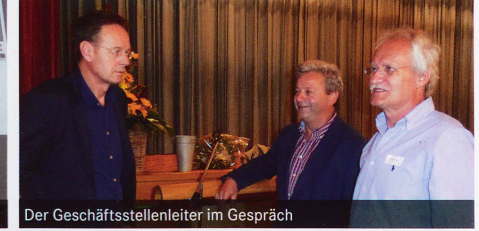
Der Geschäftsstellenleiter im Gespräch