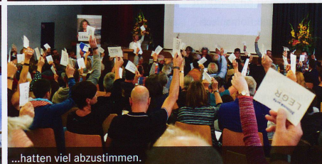
...hatten viel abzustimmen.