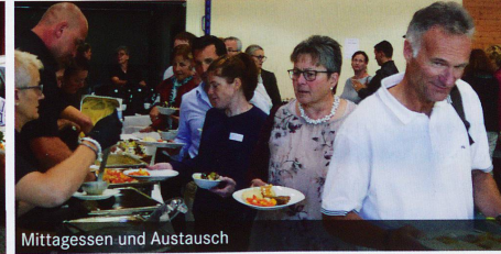
Mittagessen und Austausch