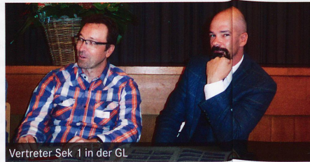
Vertreter Sek 1 in der GL