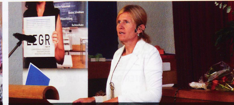
Die Präsidentin eröffnet die Delegiertenversammlung