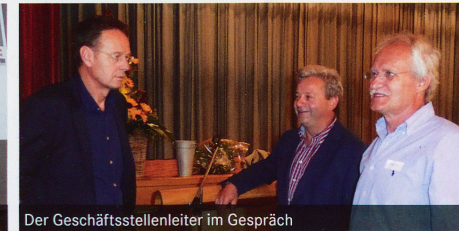
Der Geschäftsstellenleiter im Gespräch