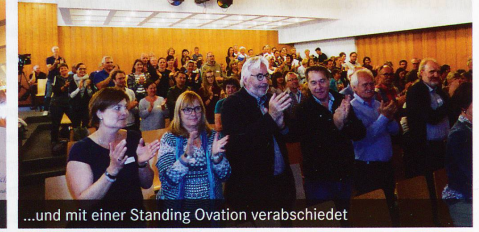
...und mit einer Standing Ovation verabschiedet