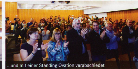
...und mit einer Standing Ovation verabschiedet