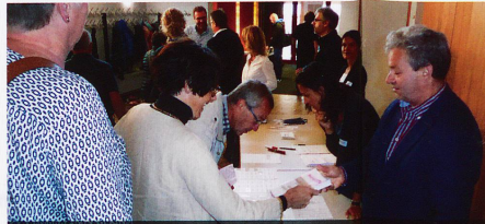
Einchecken der Delegierten und Gäste