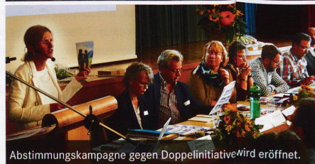
Abstimmungskampagne gegen Doppelinitiative wird eröffnet.