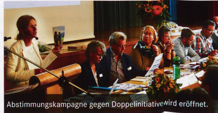
Abstimmungskampagne gegen Doppelinitiative wird eröffnet.