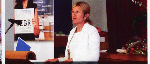
Die Präsidentin eröffnet die Delegiertenversammlung