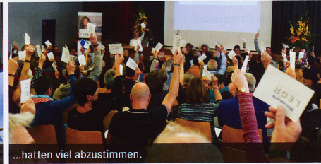
...hatten viel abzustimmen.