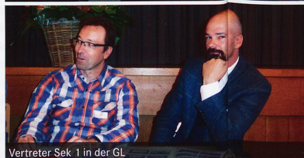
Vertreter Sek 1 in der GL