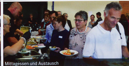
Mittagessen und Austausch