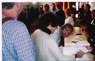
Einchecken der Delegierten und Gäste