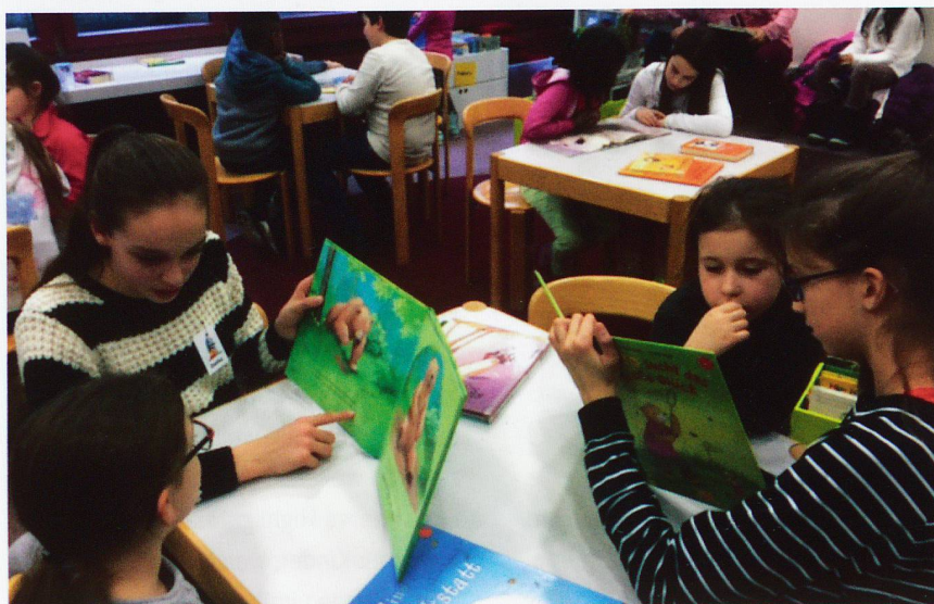
Lesegotten und Lesegöttis lesen mit ihren Gottenkindern.

Pro Jahr finden 20 Leseplatzveranstaltungen statt. 10 Mal im Jahr wird jeweils am Donnerstag von 17.00 – 19.00 Uhr ein Leseplatz durchgeführt. Der Leseplatz ist absichtlich ausserhalb der Schulzeit eingerichtet, damit die Kinder extra kommen und sich bewusst für die Teilnahme entscheiden müssen. Gewöhnlich findet er in der Schulbibliothek statt. Die Kinder müssen sich nur anmelden, wenn er ausserhalb des Schulhauses, z.B. im