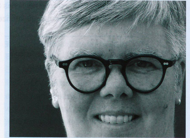
Prof. Dr. Evelyn Wannack

Gerade die digitalen Spiele, auf die sowohl die allgemeinen Merkmale des Spiels als auch die Erkenntnis-Dimensionen zutreffen, zeigen den Spielraum des Ausprobierens, des Entrinnens und zugleich der Weltöffnung auf. Die «Gamification» nutzt diesen Spielraum, indem spieltypische Elemente in unterschiedliche Kontexte übertragen werden. Dieser Trend durchdringt bereits verschiedenste Lebensbereiche und macht auch vor der Schule nicht halt. Fuchs et al. (2014) setzen sich kritisch mit diesem Trend auseinander. So sind wir weiterhin herausgefordert, über den pädagogischen Einsatz des Spiels in all seinen Facetten nachzudenken.