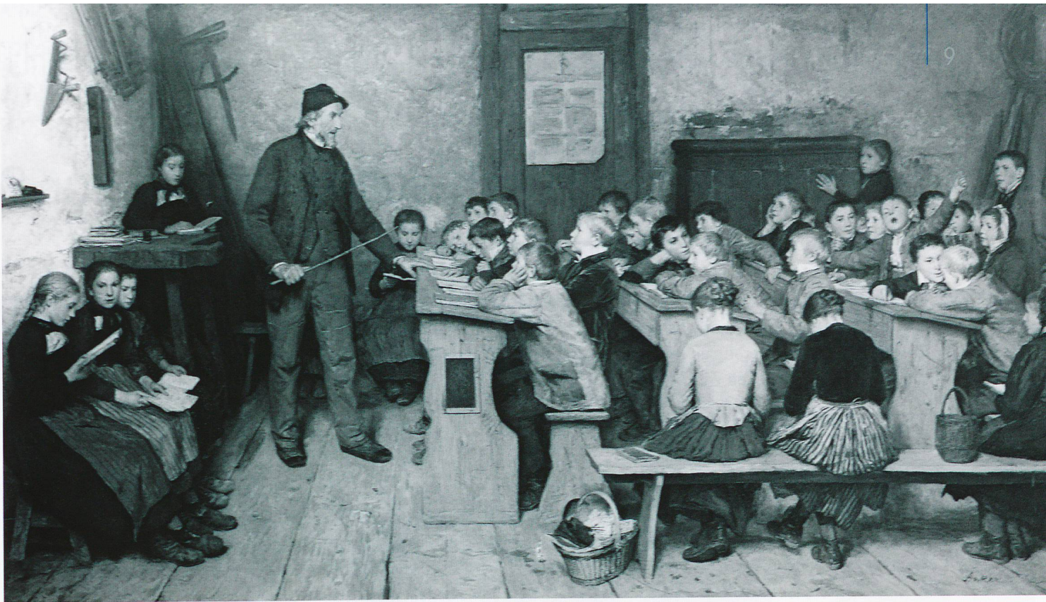
Albert Samuel Anker: Die Dorfschule von 1848