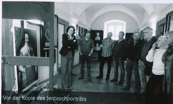
Vor der Kopie des Jenatschporträts