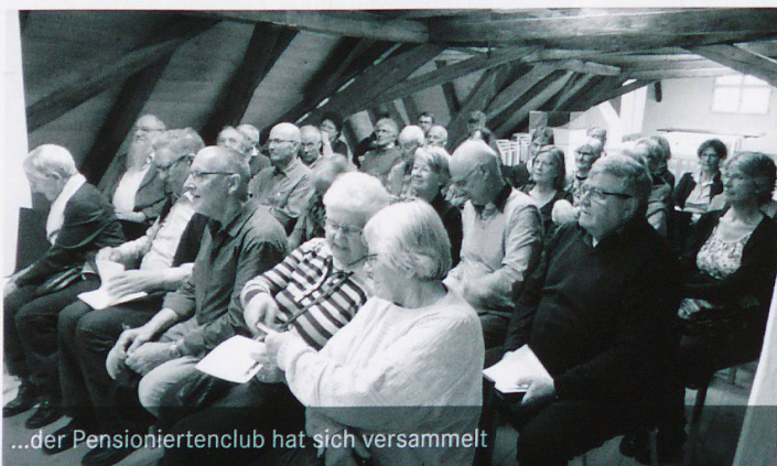
...der Pensioniertenclub hat sich versammelt