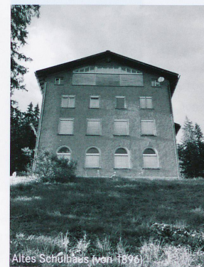
Altes Schulhaus (von 1896)