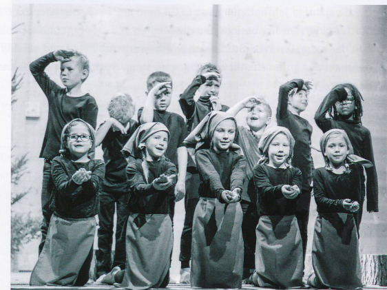
Kindertheater «Flurina und das Wildvöglein»

In der 5. und 6. Klasse nehmen alle Schülerinnen und Schüler am Zukunftstag teil. In der 2. Klasse der Sekundarstufe Arosa findet eine Lektion Berufswahl statt. Die Schnupperlehren finden – sofern möglich – während der Schulferien statt. Besichtigungen werden in einigen Betrieben von Arosa angeboten. Andere Berufsleute kommen direkt in die Schule und versuchen mit einer Präsentation die Schülerinnen und Schüler für eine Berufslehre zu gewinnen. Die Fiutscher-Ausstellung in Chur bietet einen weiteren Meilenstein auf dem Weg der Berufsfindung. Zudem kommt die Berufsberaterin jeden Herbst nach Arosa und referiert an einem Elternabend über die Begleitung der Jugendlichen bei der Berufswahl. Die 2. Klasse holt weitere Informationen anlässlich eines Besuches im Berufsinformationszentrum (BIZ) ein.