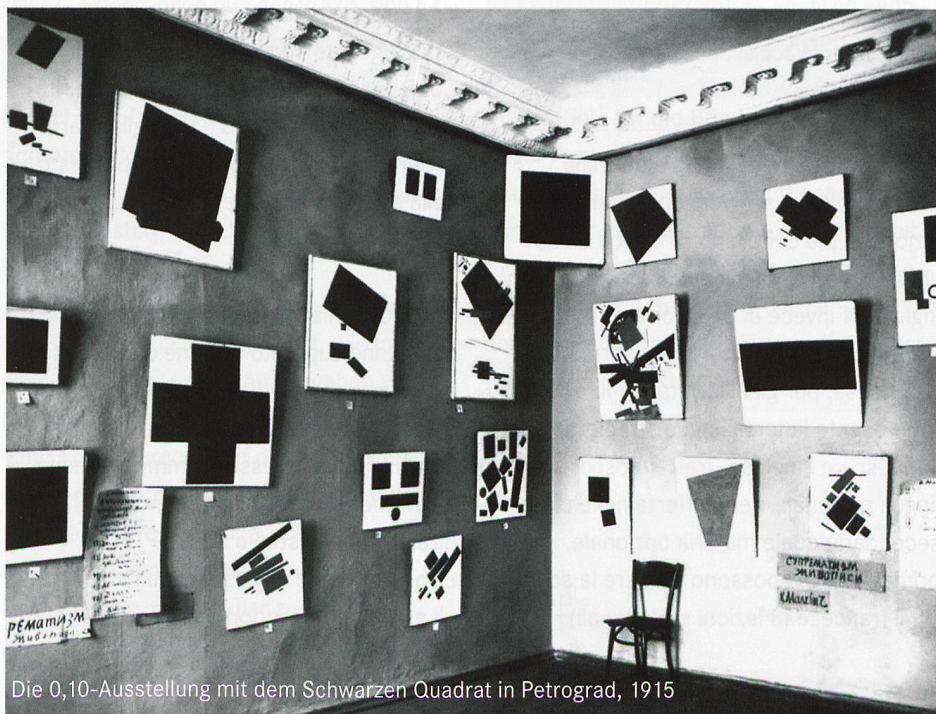
Die 0,10-Ausstellung mit dem Schwarzen Quadrat in Petrograd, 1915