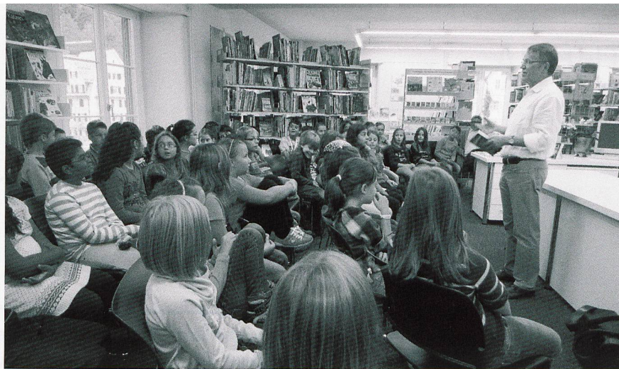
Kinderbuchautor Jürgen Banscherus begeistert mit seinen Geschichten Churer Kinder

Es ist nötig, Geschichten für das Erzählen vorzubereiten, sie durchzudenken (Sinngelalt, Gefühle, Wertungen, Gliederung, Metaphern, Dynamik, Spannungsbogen, ungewöhnliche Ausdrücke etc.) und «erzähltechnisch» einzuüben (Stimmführung, Lautstärke, Artikulation, Sprechtempo, Sprechpausen, Augenkontakt, Hilfsstichwörter etc.). Hinweise zur Vorbereitung einer Erzählung finden sich in Gasser (2003).