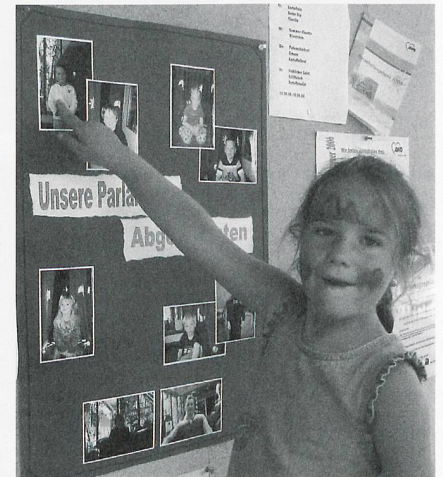
«Die anderen haben mich gewählt.»

Die Auseinandersetzung mit der eigenen Haltung und die Reflexionsfähigkeit des eigenen Handelns nehmen einen besonderen Stellenwert ein. Erwach-