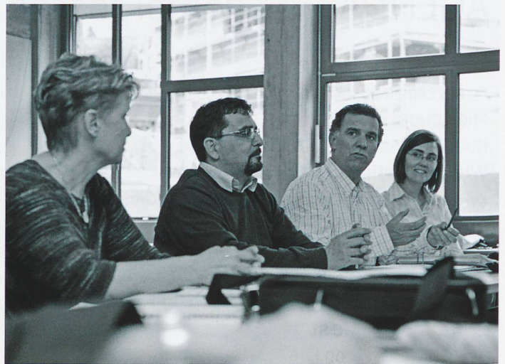
Als Wiedereinsteiger/in zunächst selber die Schulbank drücken – wie hier die gestandenen Lehrpersonen an der Bündner Schulleitungsausbildung 2010.

Graubünden sei klar da und noch keinesfalls vorüber. «Vor allem Lehrpersonen romanischer Muttersprache, Heilpädagogen und Lehrpersonen auf der Oberstufe sind ausgesprochen Mangelware.»