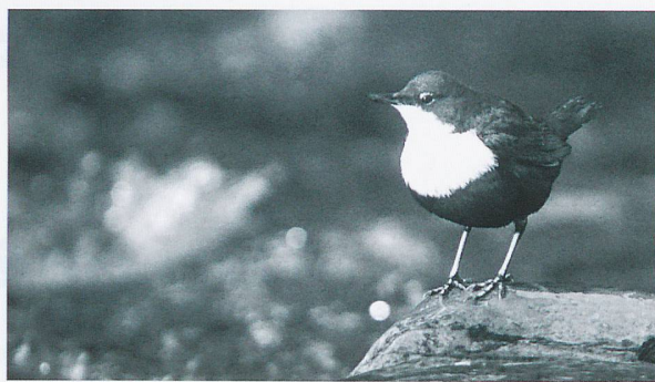
Die Natur beobachten: Wanderung «A la riva dal Rom»