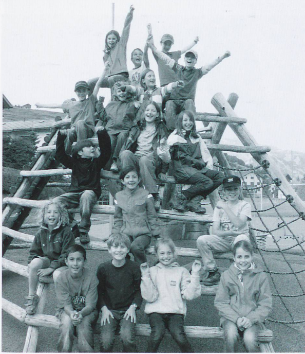
Schulklasse in Falera