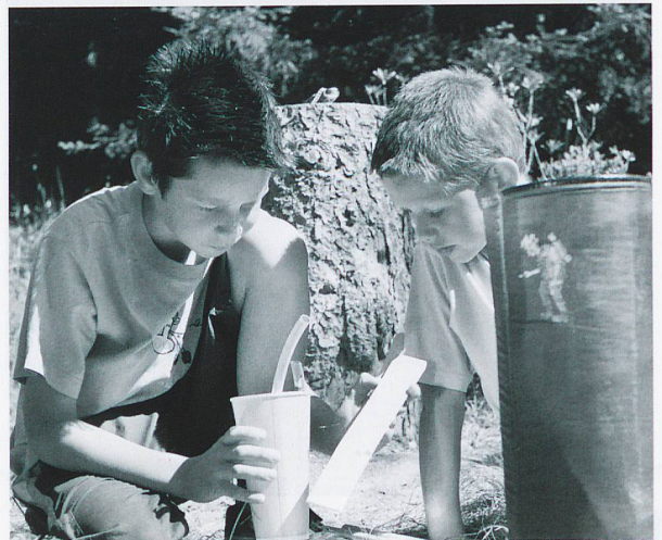
Forscherparcours auf der Alp Flix

Anreise mit der RhB nach Bergün. Auf halbem Weg finden Sie einen Unterstand und eine Grillstelle zum Verweilen.