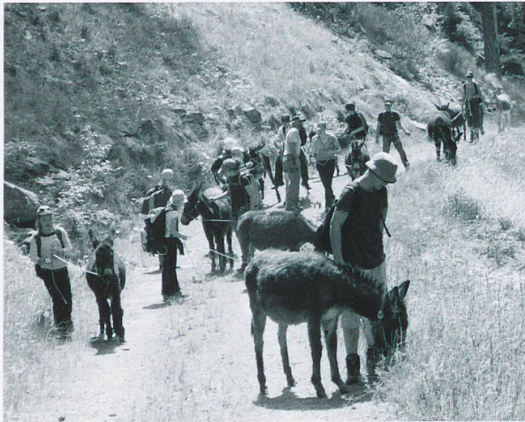
Eseltrekking in Fuldera