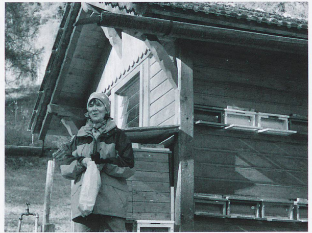
Weshalb gibt es die «schwarze» Biene im UNESCO-Biosphärenreservat Val Müstair?