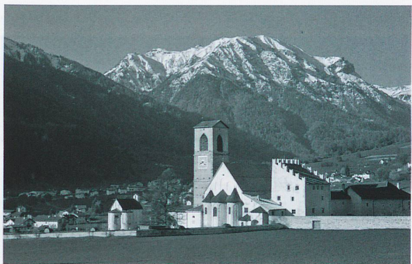
UNESCO Welterbe: Kloster St. Johann in Müstair