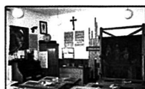
Praxishilfen für das Classroom-Management