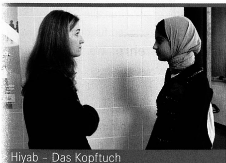
Hiyab – Das Kopftuch