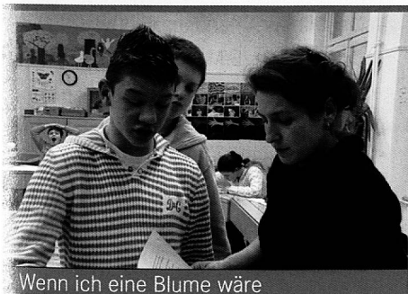
Wenn ich eine Blume wäre

mentar- und Kurzspielfilme, die speziell für den Unterricht ausgewählt und mit didaktischem Begleitmaterial ergänzt wurden und bei «Filme für eine Welt» erhältlich sind – Filme, die Themen aus ganzheitlicher Perspektive aufgreifen und für nachhaltige Entwicklung und eine zukunftsfähige Gesellschaft plädieren.