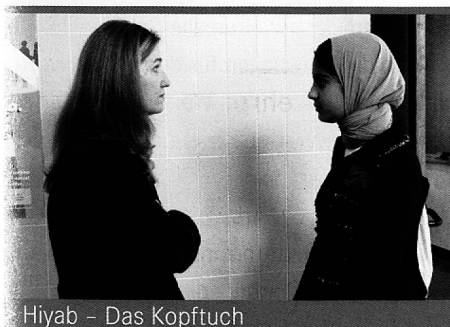
Hiyab – Das Kopftuch