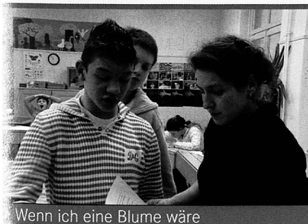
Wenn ich eine Blume wäre

Jedes Jahr anfangs November wird Thusis für ein paar Tage zur Welt-Stadt. Im Kino Rätia flimmern die neusten Filme aus Afrika, Asien und Lateinamerika über die Leinwand. Filmfans und Kulturinteressierte aus der näheren und weiteren Umgebung finden sich ein, um das reichhaltige Programm und die tolle Stimmung zu geniessen.