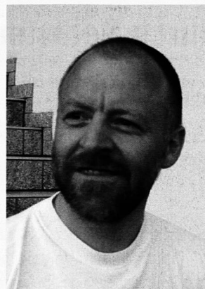
VON MARTIN MATTHEI

Viele unserer Probleme im Schulalltag (und in der Gesellschaft) haben ihren Ursprung in mangelndem Selbstmanagement der Lehrpersonen, der SchülerInnen, der Schulratsmitglieder, der Eltern.