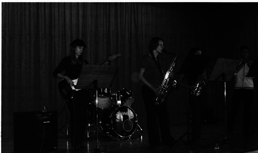
Ein Warm Up mit der Semi-Dixieband

heisst, Mängel in der Allgemeinbildung müssten im Verlaufe des Studiums behoben werden.