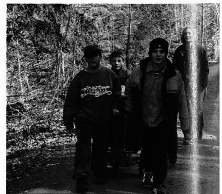
Fein säuberlich in einer Wärmebox versorgt, transportieren die Schüler das Mittagessen auf einem Anhänger einige hundert Meter die steile Strasse von der HTF in die Tagesschule hinauf.